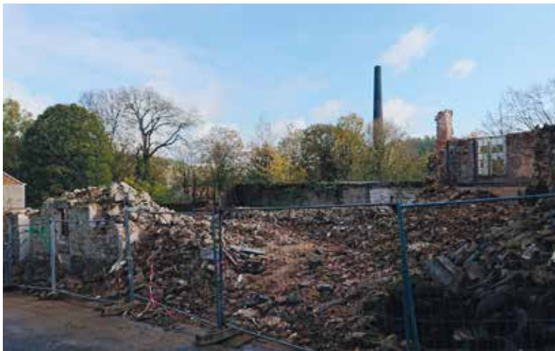
Aménagements de garage et d'une chicane sur la RD46