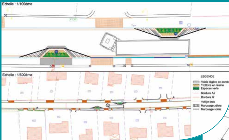
Chicane Rue Félix Près