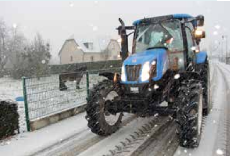
Premiers flocons de neige... Jojo en mode salage