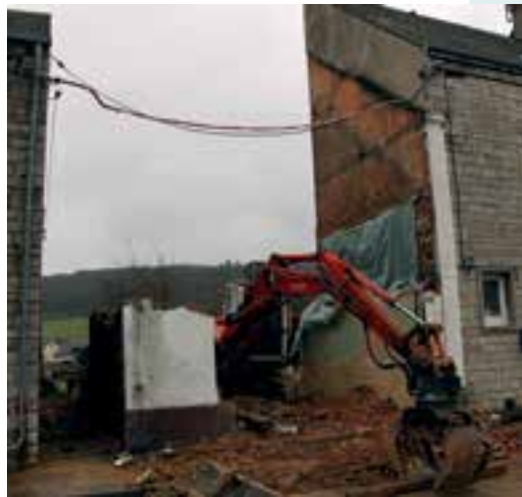
Place des Rentiers... la maison Stawiaski en sécurité