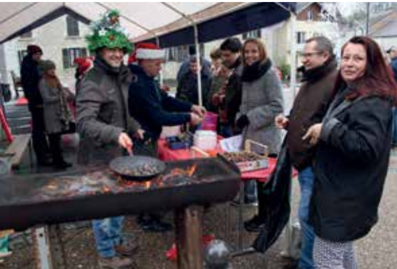
Chaud... les marrons chauds