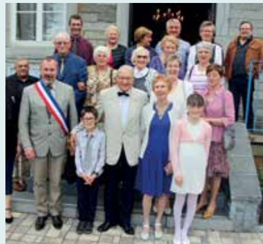
M & M me Schweitzer... 60 années en coopérative