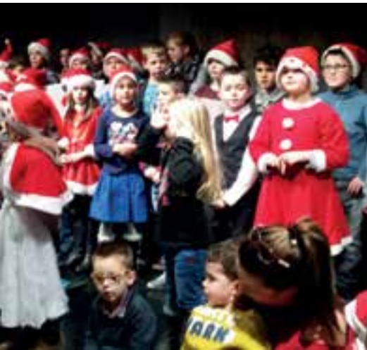
Marché de Noël... la chorale des Ecoles