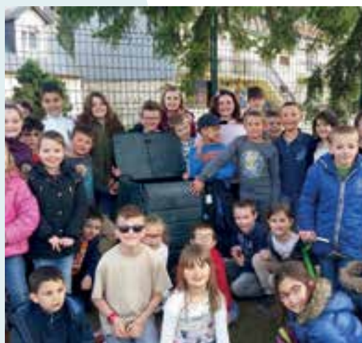
Le compostage... élémentaire à l'école