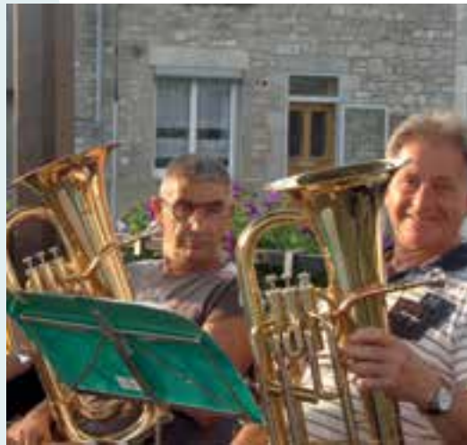
Faites de la musique... ça pistonne en harmonie