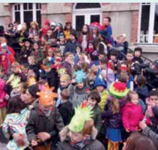
Moment de récréation... les écoles font leur carnaval