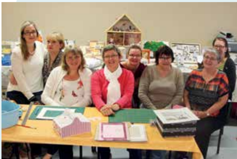
La F.A.L... l'atelier d'art et de loisir