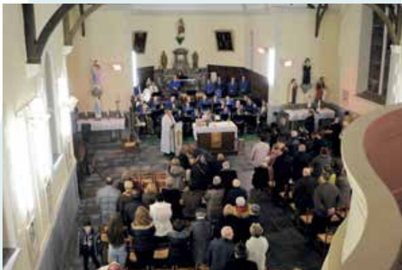
Sainte Cécile... les musiciens fêtent leur patronne