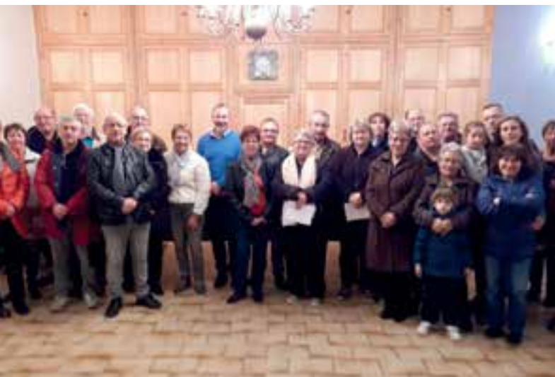
Maisons fleuries... les lauréats à l'honneur