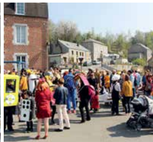
Avec le Comité des Fêtes... une ambiance de carnaval