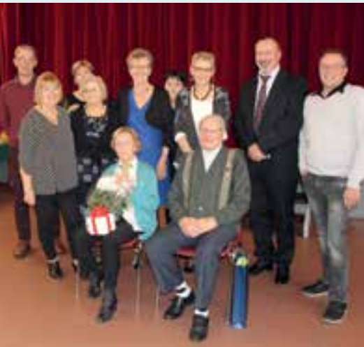
Comité des Anciens... bon aîné, bonne santé