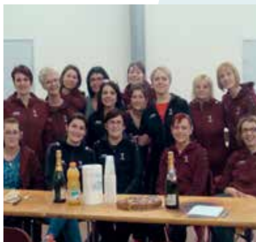
Vis ta Gym... que des reines !