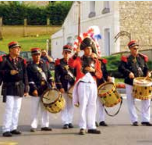
Les Grenadiers Suisses... en campagne tambour battant