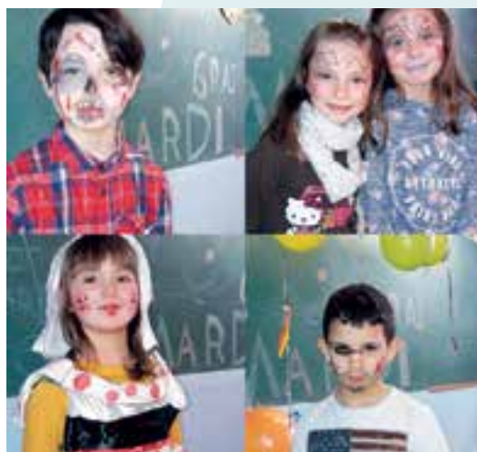
Périscolaire... une étude en grimage