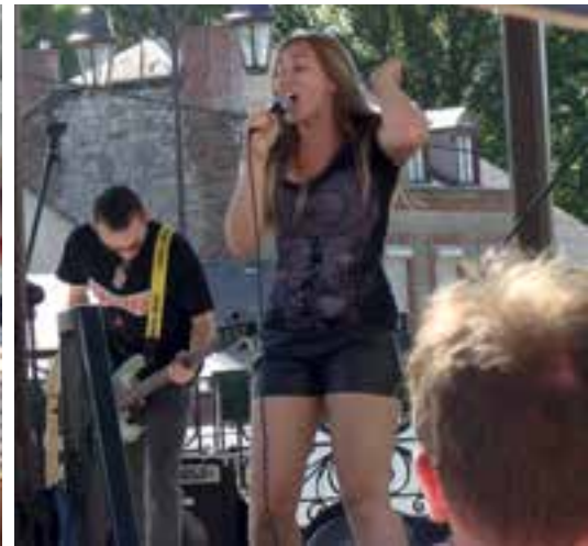
Fête de la musique... ça chauffe pour le 1 er jour de l'été