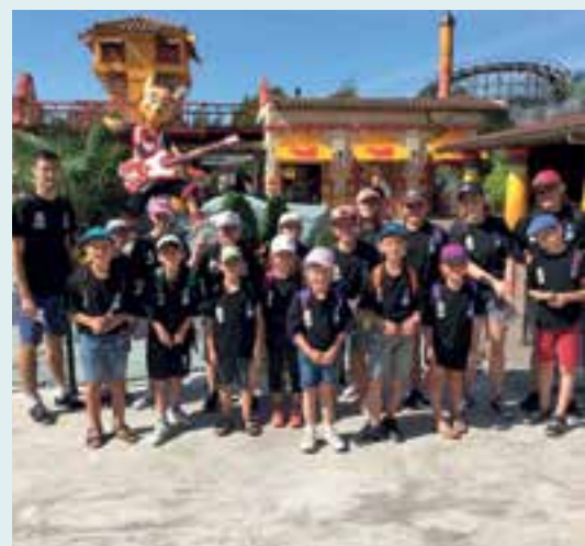
Centre aéré d'été... d'aventures en aventures