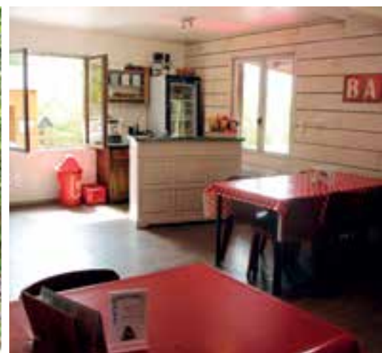
Cl traiteur... le chalet des grottes restauré