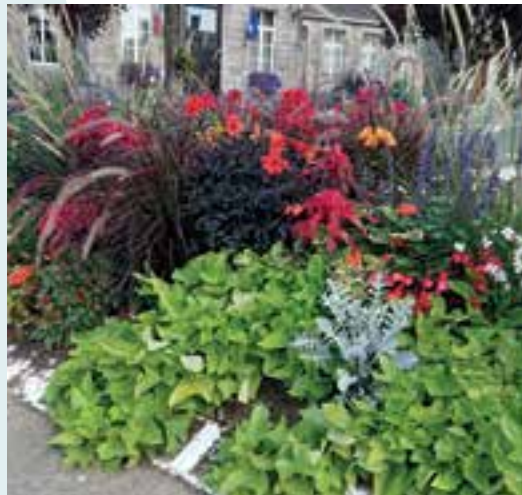
Village fleuri... une fleur pour nos jardiniers