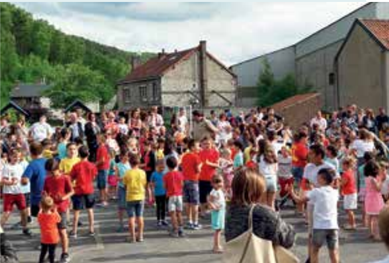
Les élèves des 2 écoles... à la fête