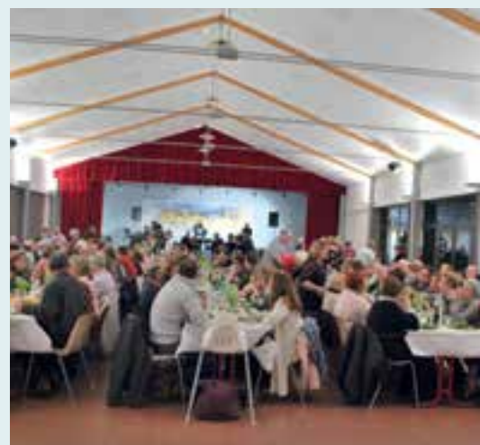
Harmonie Municipale... la recette de la choucroute