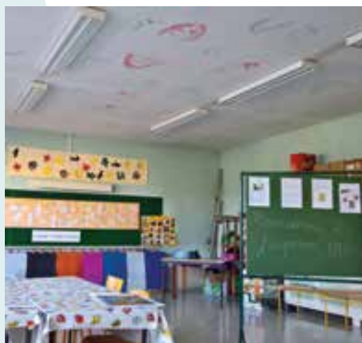
École élémentaire... au tableau Matisse