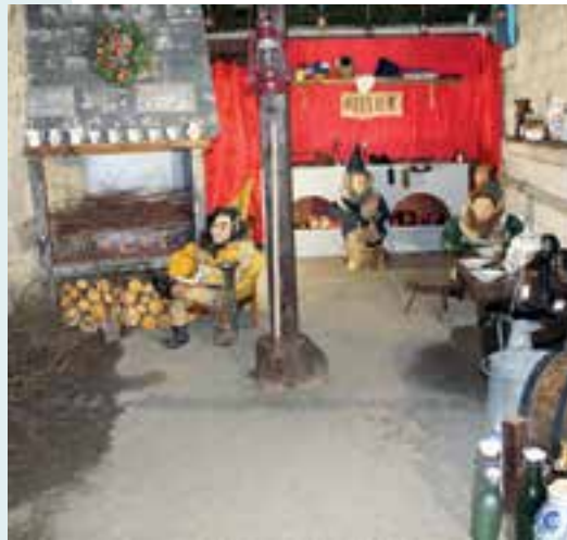
Employés communaux... l'atelier des Nutons à la Mairie