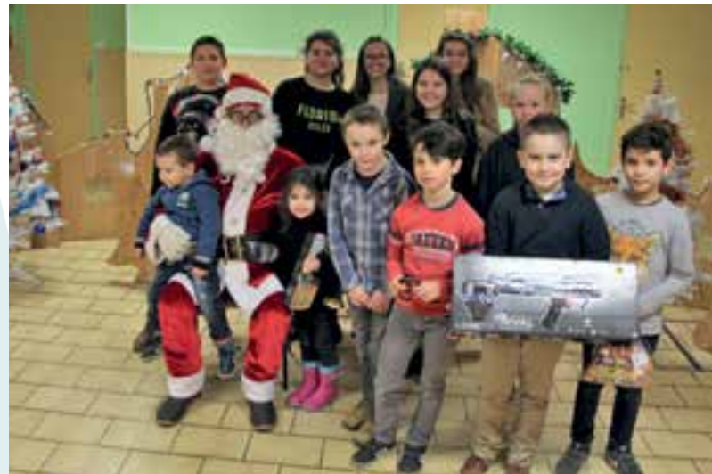
Noël des communaux... les travaux du Père Noël