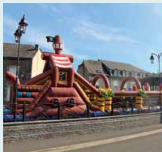
Fête patronale... des châteaux, c'est gonflé !