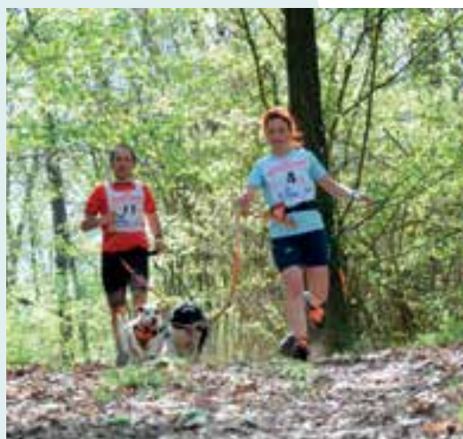
Cani-cross... la voix de son maître !