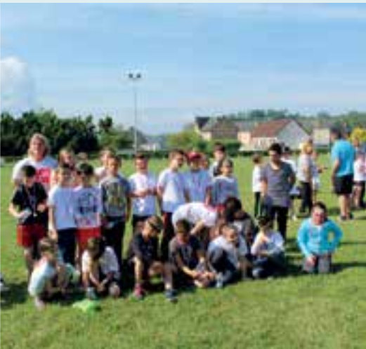
Cross de l'école... les Nutons sur le gazon