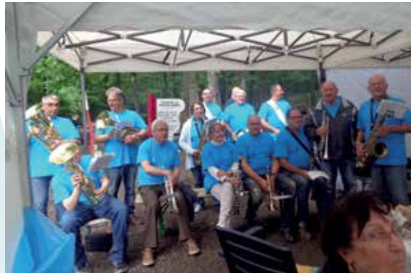
Barbecue à Nichet... des schtroumpfs musiciens