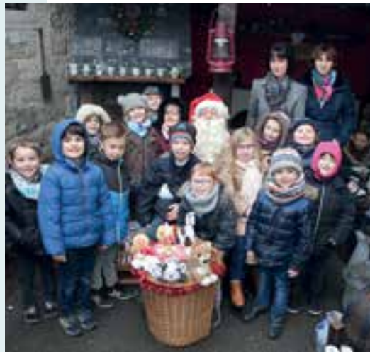
Classe CP/CE1... les enfants prennent le pouvoir