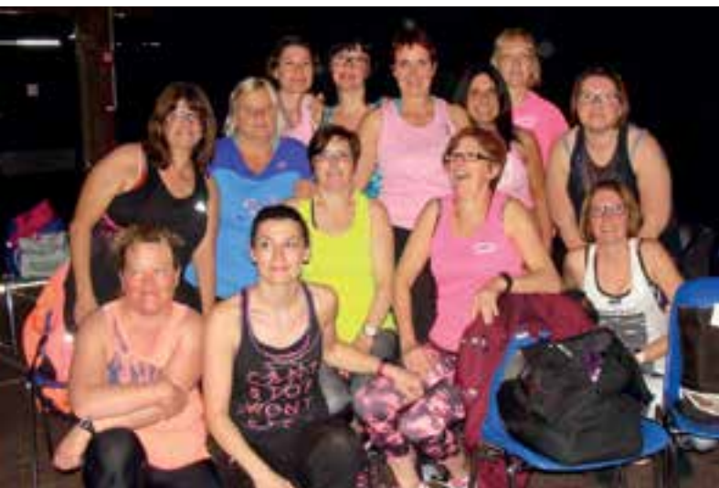
Vis ta gym... au repos pour la 6 e nuit du fitness