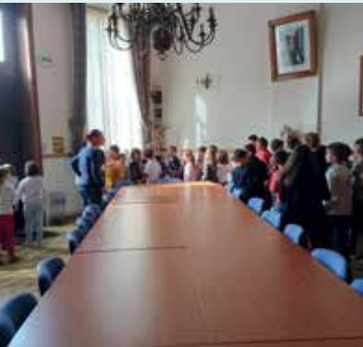
École Élémentaire... exercice de mise en sécurité