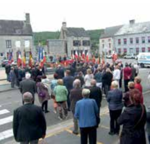
Libération de Fromelennes... devoir de mémoire