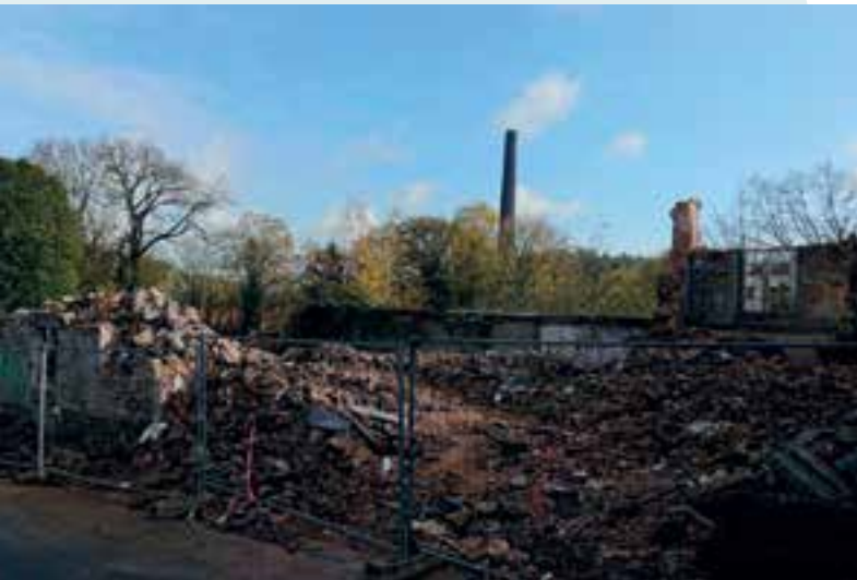
À Flohimont... la cité KME fait table rase