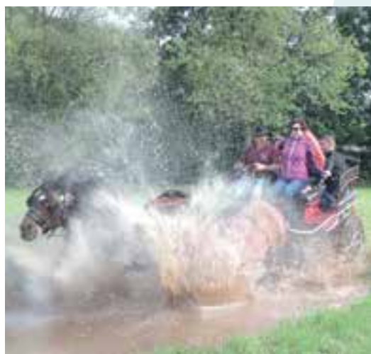
Fête du cheval... la Ferrade se mouille