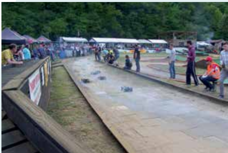
B.F.R.C... le buggy en piste à la Manufacture