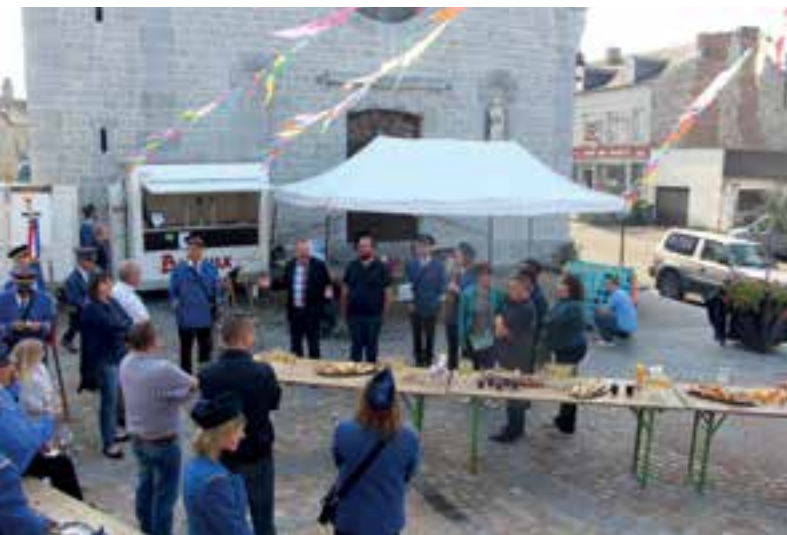
Fête patronale... la place de l'église à l'honneur