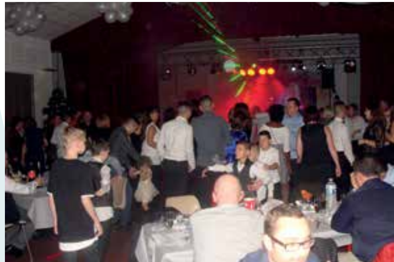
Saint-Sylvestre ... la der de l'année