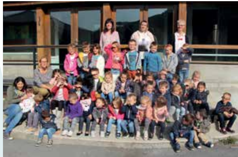
À l'École Maternelle ... la rentrée des doudous