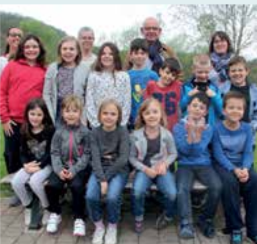
Centre aéré... un printemps radieux