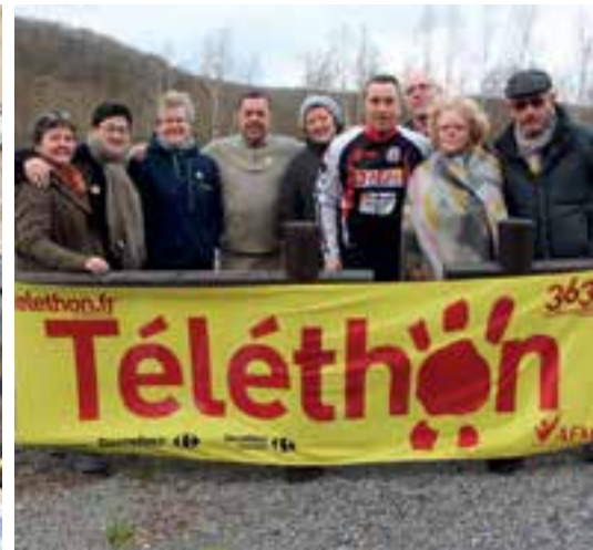
Téléthon... les organisateurs à l'œuvre