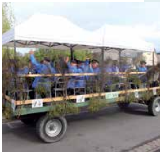
Une musique... haut la main !