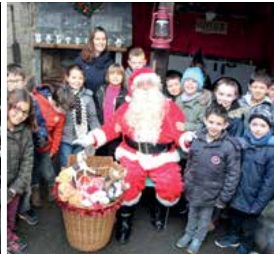
Classe CE1/CE2... le cartable du Père Noël