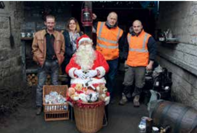
Classe communale... à bonne école avec un bon devoir