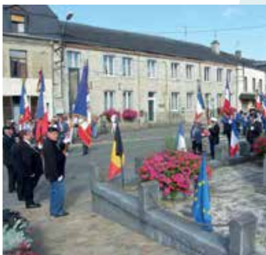
Fête nationale... recueillement au monument