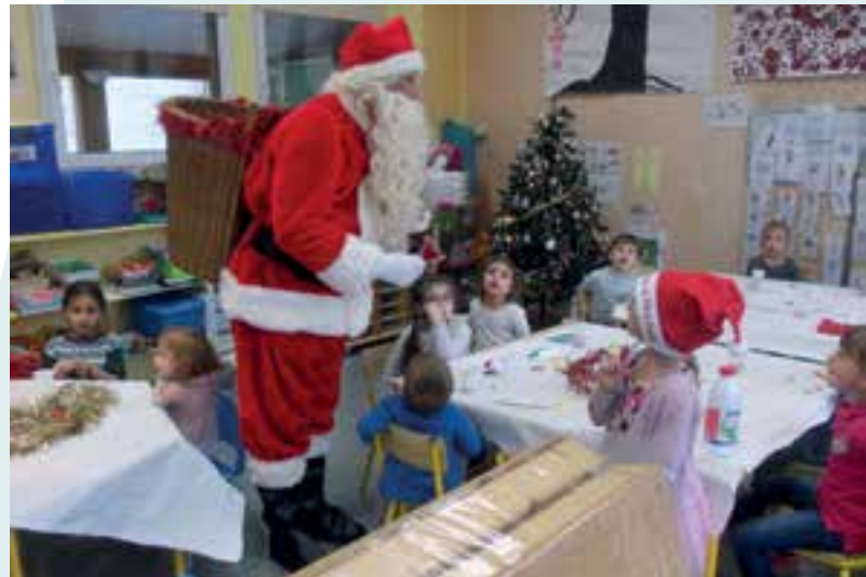
Classe CM1/CM2... à l'atelier des Nutons, c'est qui le maître ?