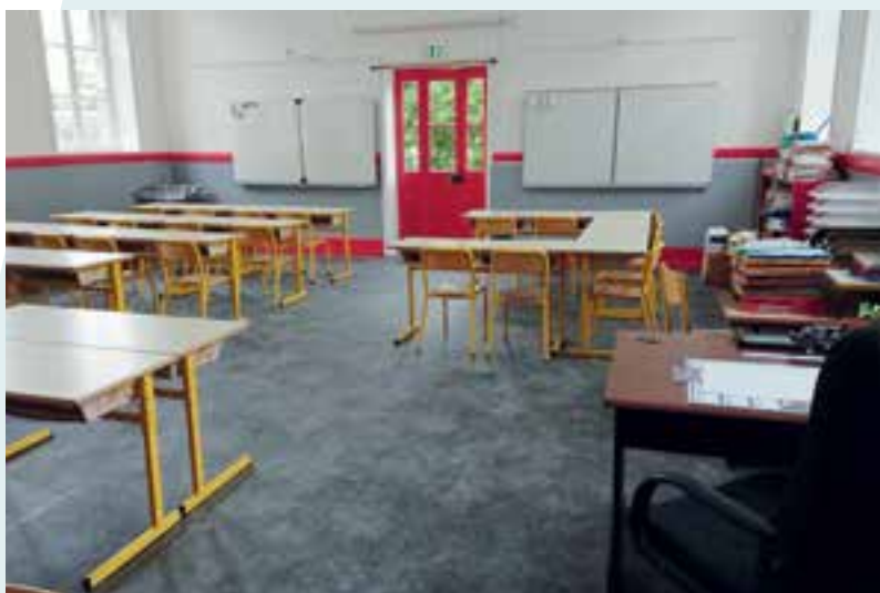
Oh ! La classe...coup de jeune à l'école élémentaire