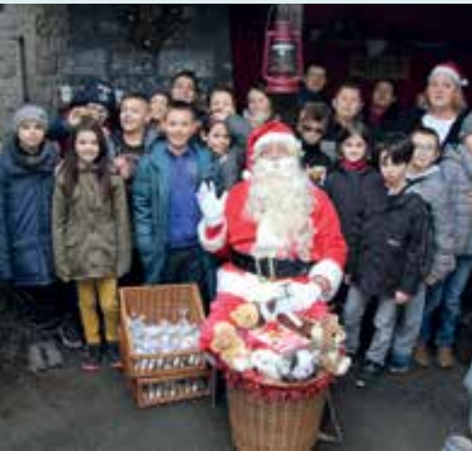
À l'école maternelle... une leçon de maître