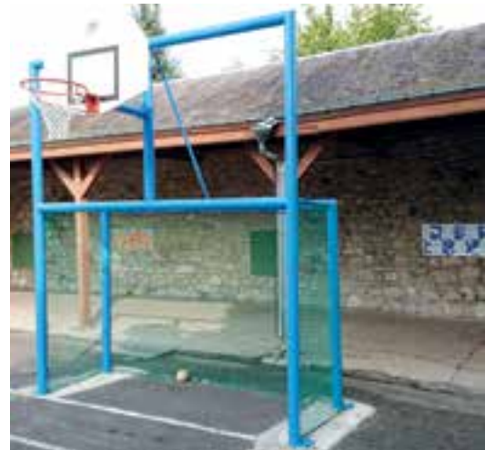
Cour de l'École Élémentaire... un cours multisports