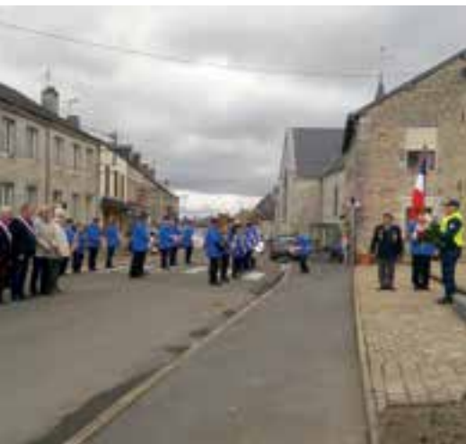
Cérémonie du 1 er mai... un brin de mémoire