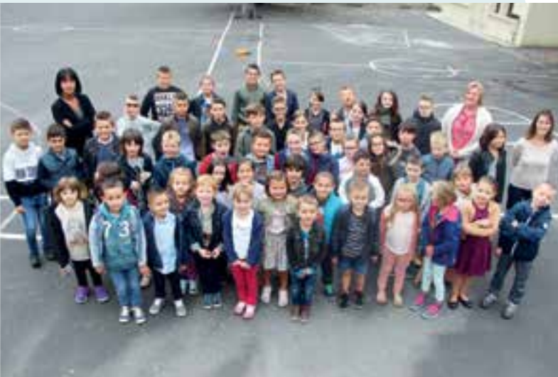
À l'École Élémentaire... la rentrée des Nutons