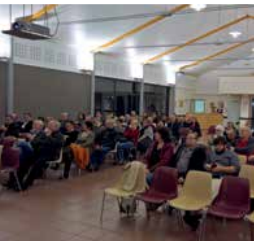
Réunion publique... une concertation citoyenne