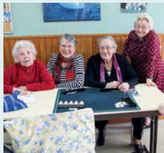
La Fontaine des jeux... au bonheur des dames