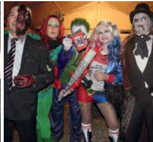
Halloween à Nichet... une soirée affreusement divertissante