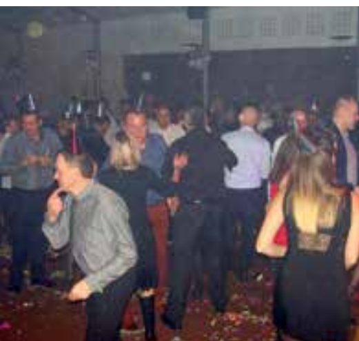
1 er jour de l'an... en dansant