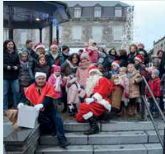
Comité des Fêtes... le Père Noël sur la plus haute marche !