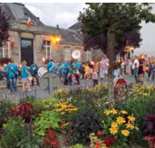
Retraite aux flambeaux... ça fleure bon !