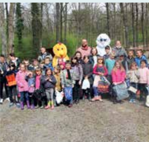
Chasse aux œufs... servie sur le plateau de Nichet