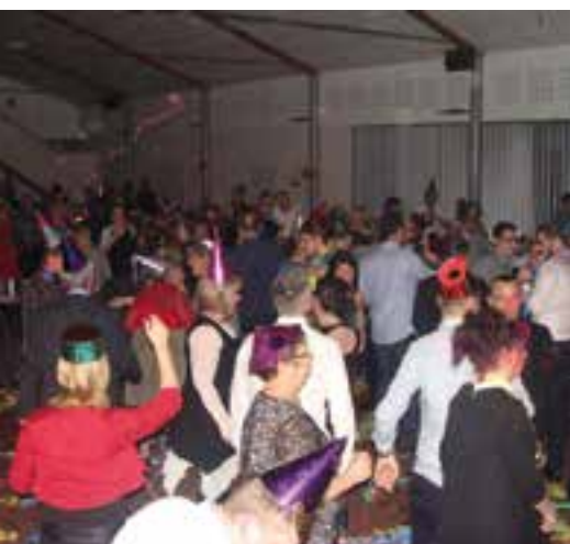
Bonne année, bonne santé... au Richat