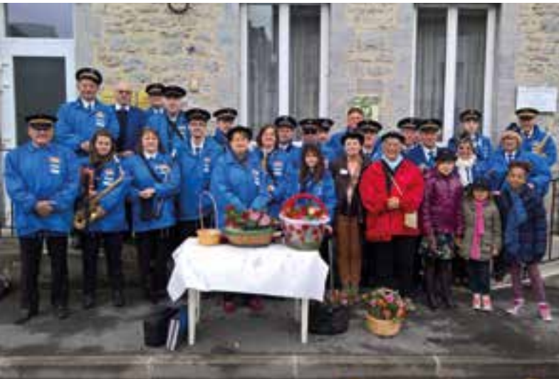
En toute harmonie... un brin de muguet