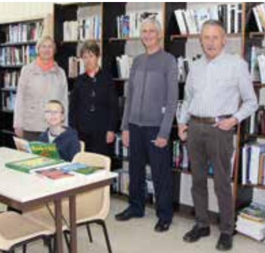
Envie de bouquiner... à la Maison pour Tous