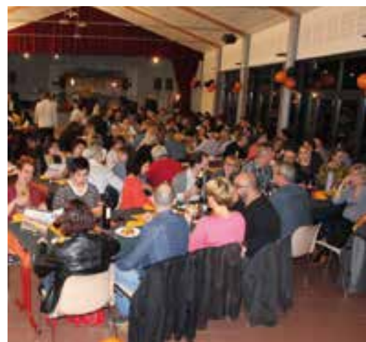
Une nuit de Tango... avec le F.C.F