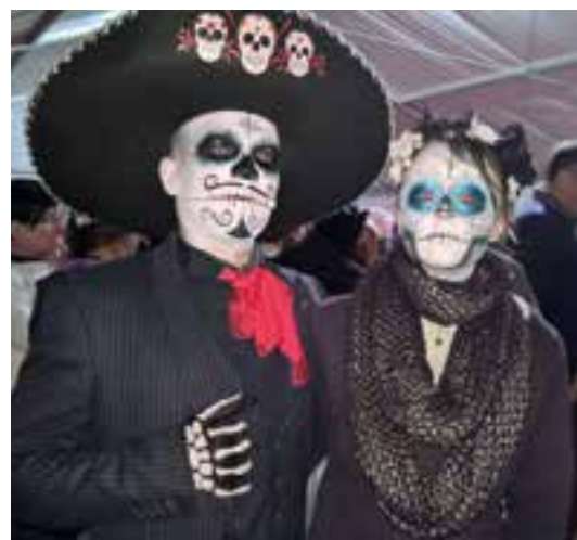
Halloween... a mis son habit d'automne sur le plateau de Niche