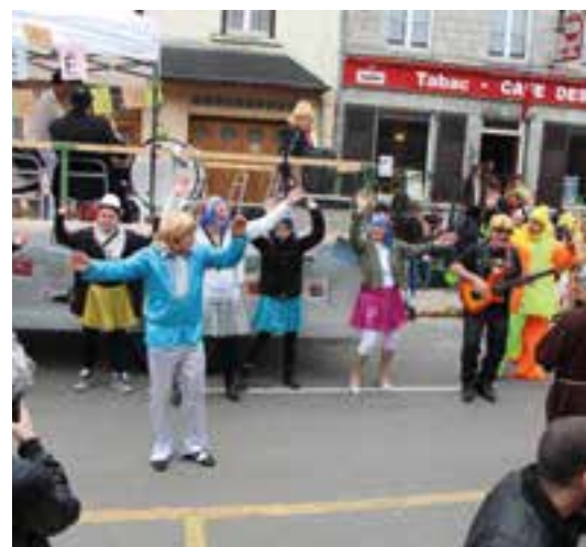
La Clo Clo mania... s'empare du carnaval