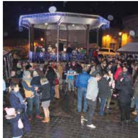
Place du marché... libérée, délivrée... la reine de Noël