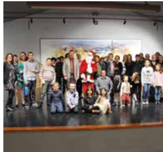
Les primaires à la commune... le Père Noël remporte tous les suffrages