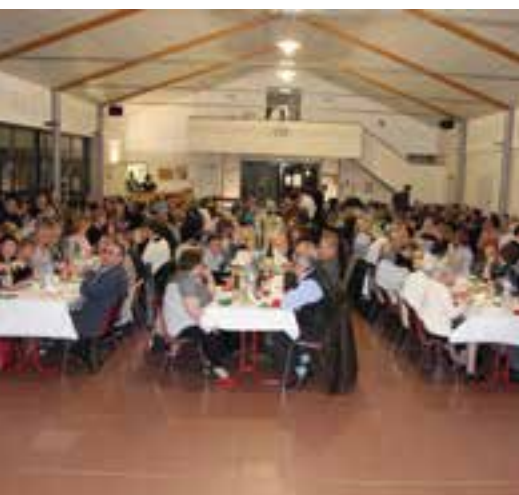
Une choucroute garnie... avec l'Harmonie Municipale