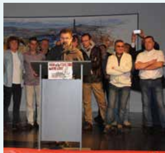
À pleins tubes... avec la reprise de KME