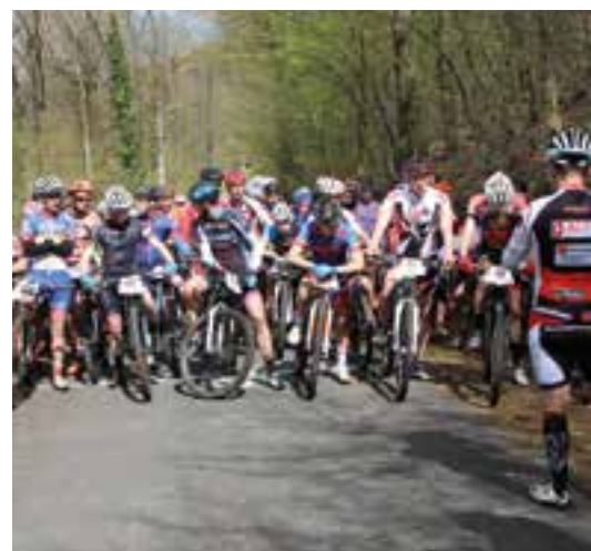
La reine des bois à Nichet... avec Ardenn' Pointe Cyclisme