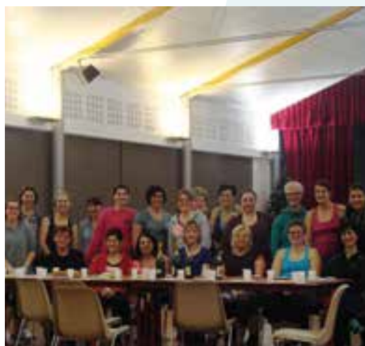
Vis ta Gym... la galette des rois !