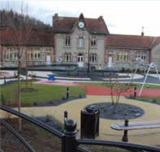
À Flohimont, faire place nette... aux Vieilles Forges