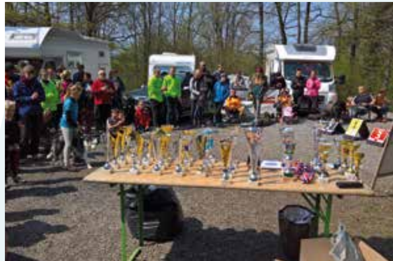
Un petit câlin... pour le sport canin