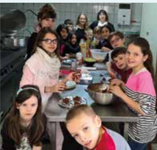
Top chef... avec le Centre Aéré