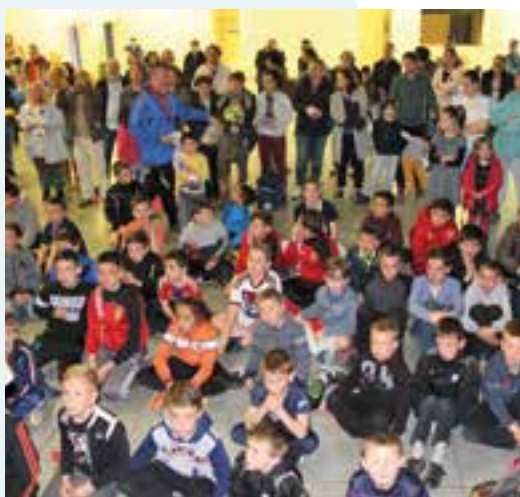
Sportez-vous bien... avec l'Entente Nord Ardennes