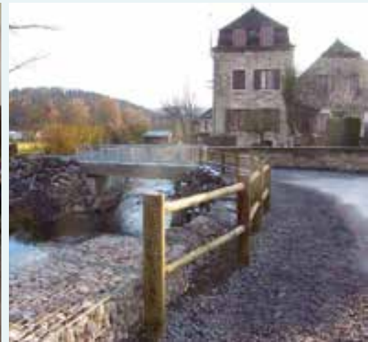
À la Manufacture... le 2 e pont et les berges se la coulent douce