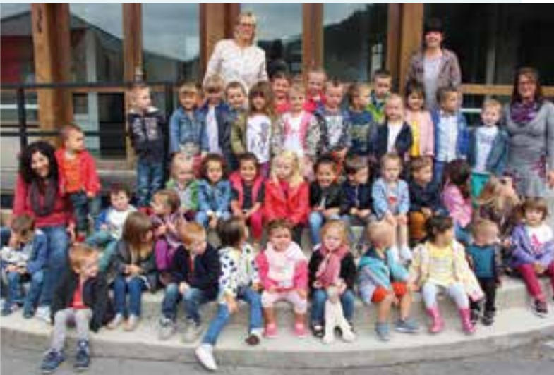
Le début du parcours scolaire... avec l'école Maternelle