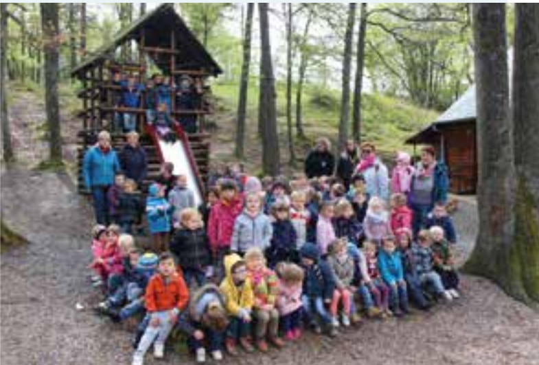
Sur le plateau de Nichet...des lutins de l'Athénée de Beauraing