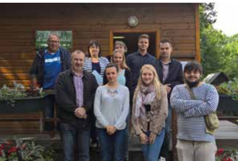
Aux grottes de Nichet... un job d'été pour les jeunes