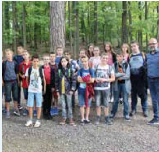
Grottes de Nichet... une rentrée classe pour l'Athénée de Beauraing