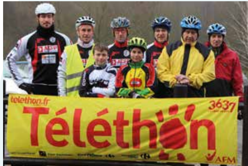
Téléthon... une mobilisation populaire pour la bonne cause