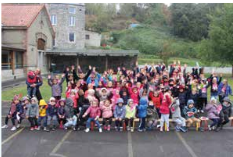
Tous pour ELA... mets tes baskets et bats la maladie à l'école