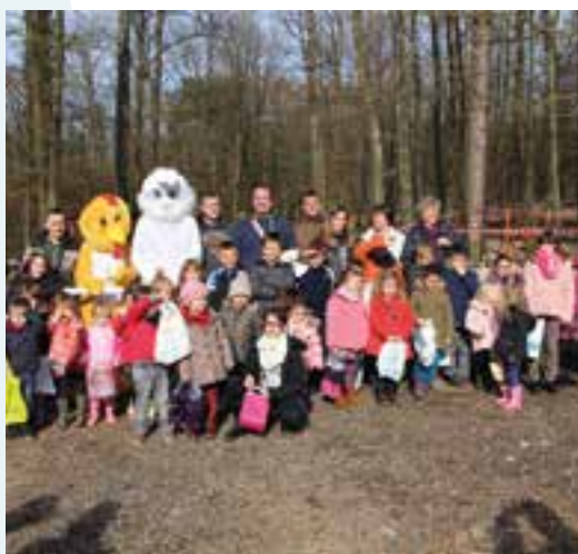
Une chasse aux œufs... radieuse