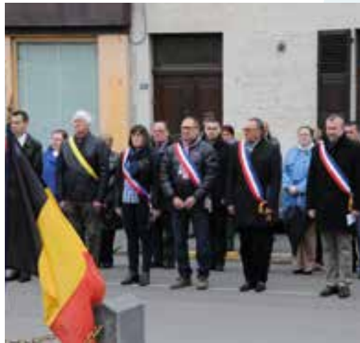
Cérémonie patriotique... un devoir de mémoire