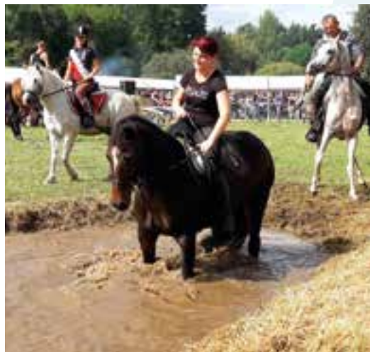
Le passage du gué... tout gai pour les cavaliers