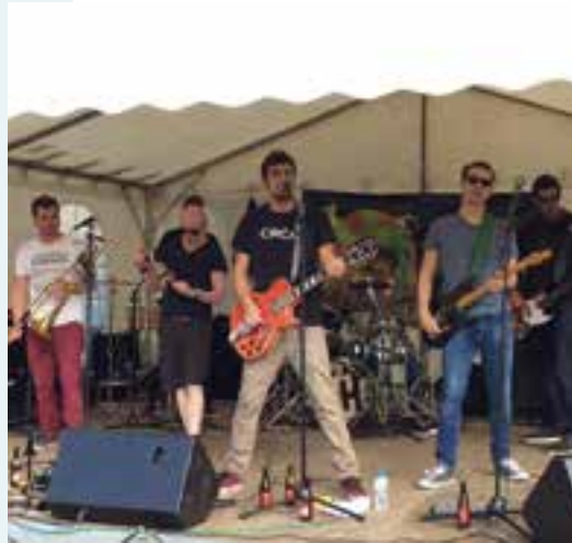
Le 1 er jour de l'été... faites de la musique !