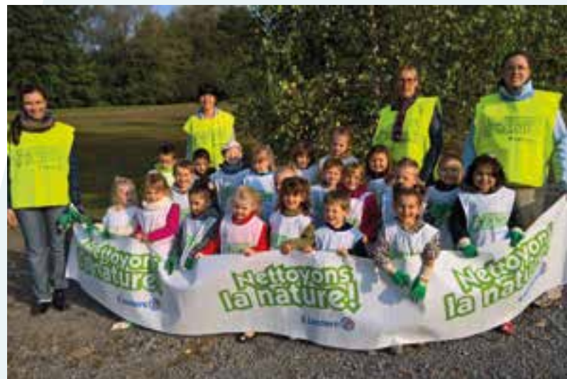
Petits éco-citoyens mais grands protecteurs de la nature