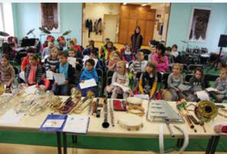
Étude sur la musique avec l'HMF... pour l'école Élémentaire