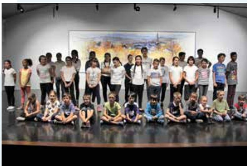
Centre aéré été ou... danse avec les stars