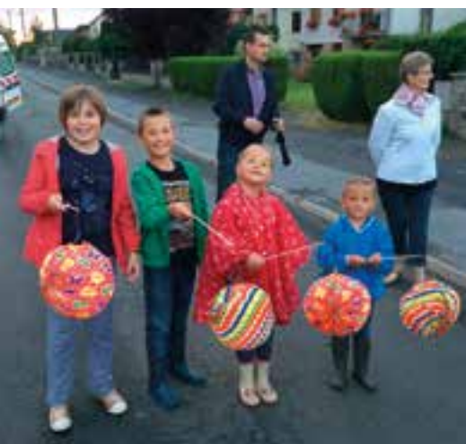
Une retraite aux flambeaux... du plus petit au plus grand