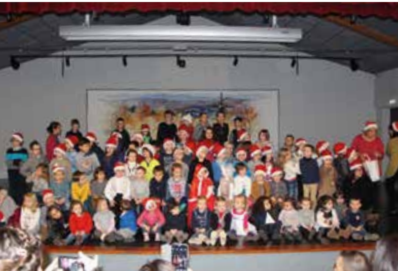
Marché de Noël des écoles... que des enfants sages !