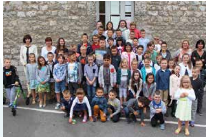
La fin des grandes vacances... avec la rentrée de l'école Élémentaire