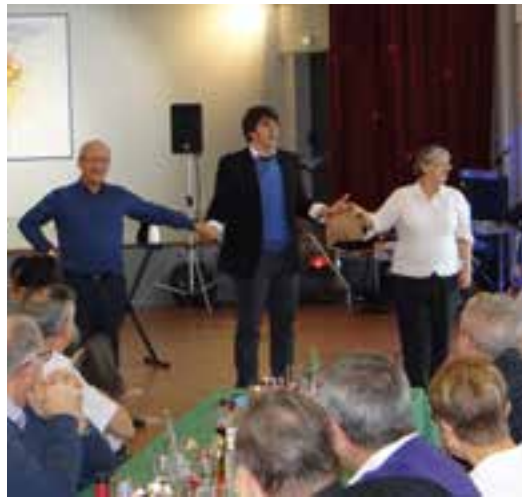
Repas des anciens... une ambiance comme par magie