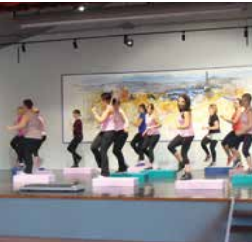
Bouger pour le téléthon... des dons : 2 709,45 euros