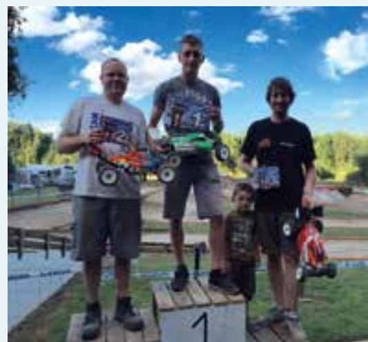
À la Manufacture... ça roule pour le Buggy fromelennois