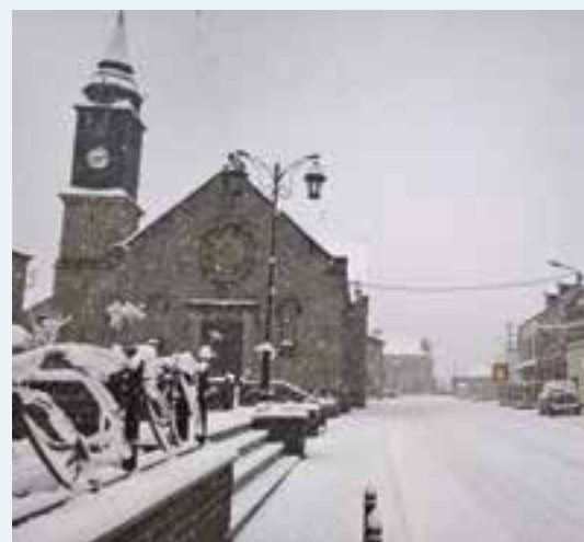
Neige de mars... brûle le bourgeon