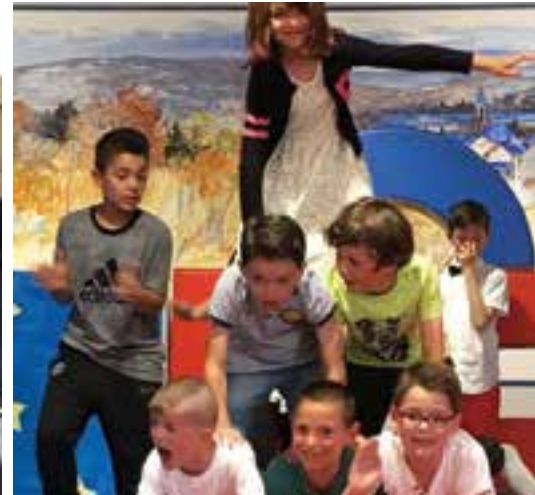
La fête des écoles... qu'est-ce que c'est que ce cirque ?