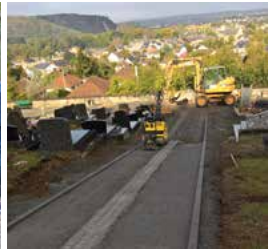
Au cimetière... l'aménagement des allées