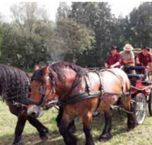
Avec la Ferrade... on s'attèle pour le 18 e anniversaire