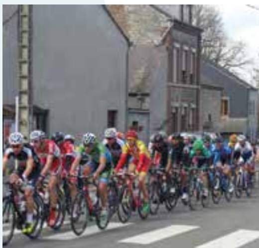
Une partie de manivelles... avec le Circuit des Ardennes