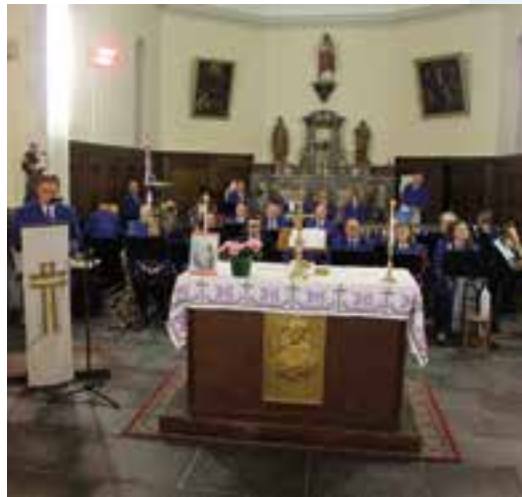
Sainte Cécile à l'église... jouez pour nous !