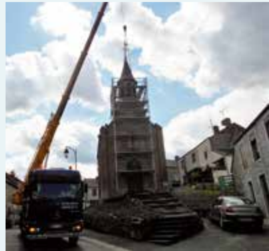
Restauration du clocher... de la chapelle Sainte-Rolande