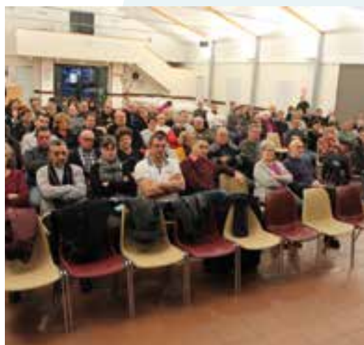
Un rendez-vous citoyens... avec la Municipalité