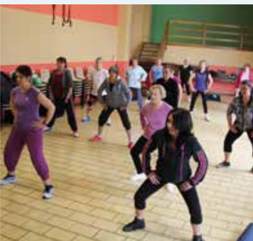
La gym en pleine forme... à la Manufacture