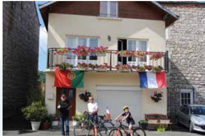
Une façade très "Euro"... un avant-gout de finale