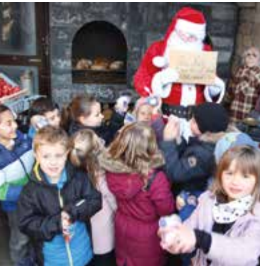
Les écoliers envoient... un recommandé !