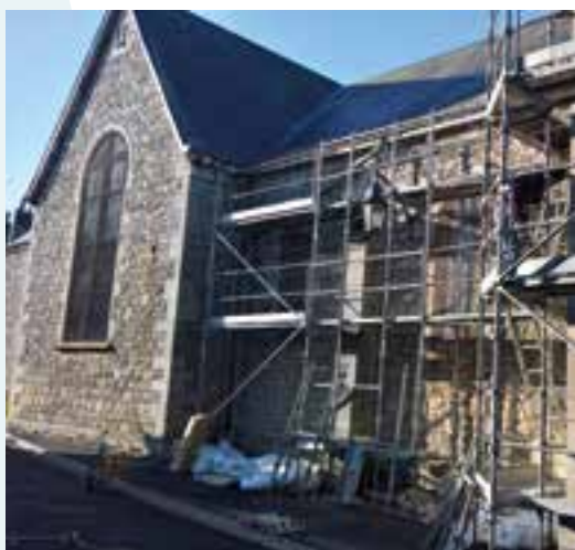
Restauration de l'église... apporter sa pierre à l'édifice