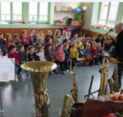
Un cours de musique... à l'école Maternelle