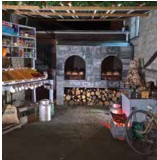
L'épicerie comme d'Antan... reproduction du Service Technique