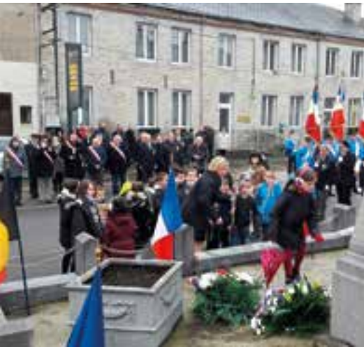
Cérémonie de l'armistice... une leçon de civisme pour les enfants des écoles