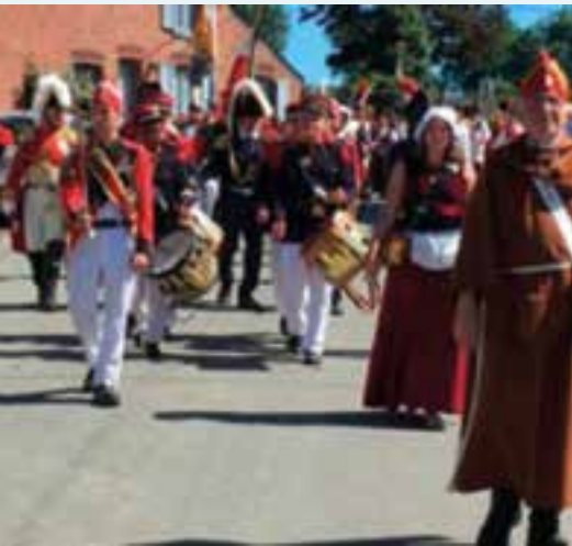
Le 3 e régiment Suisse... des grenadiers en campagne