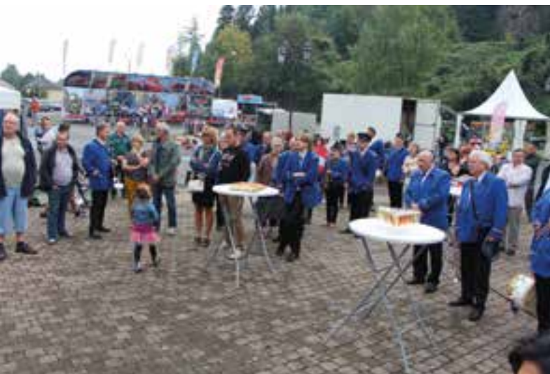
Patron... c'est la fête au village !