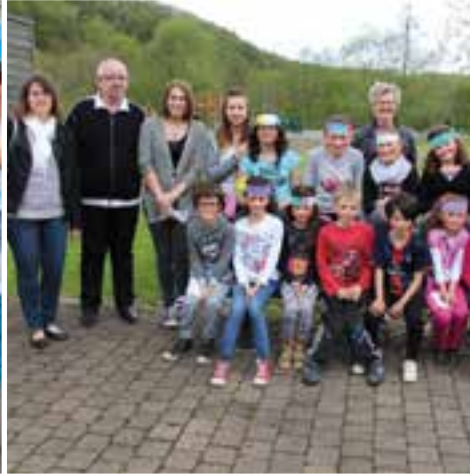
ALSH de printemps... un accueil de loisirs qui a de belles couleurs