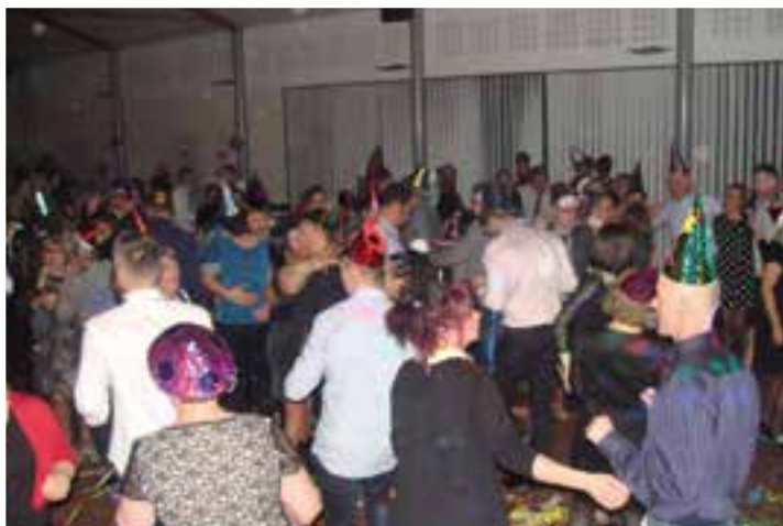
Saint-Sylvestre... la salle du Richat sur son 31