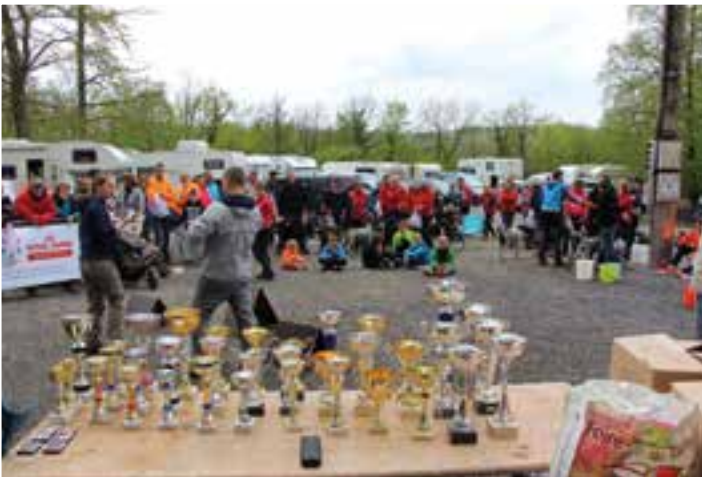
Cani-cyclo-cross à Nichet... une course qui a du chien