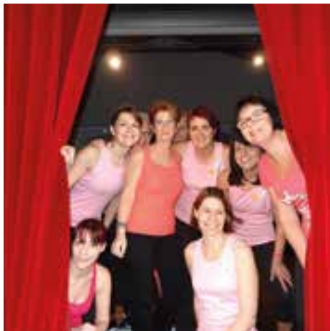
Lever de rideau... pour l'association Vis ta Gym