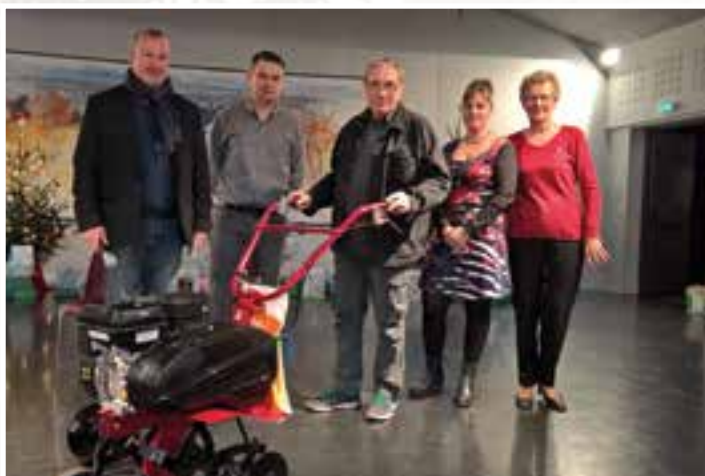
Cadeau du Père... Noël... la retraite