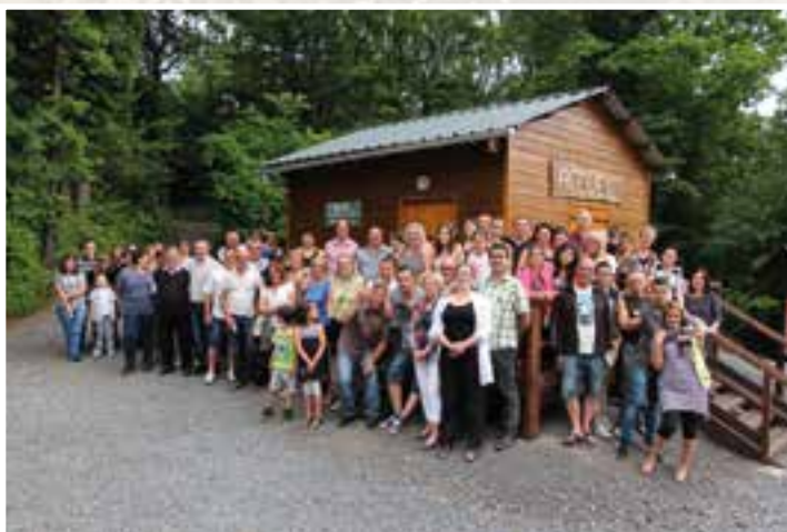
La famille communale... grandeur nature