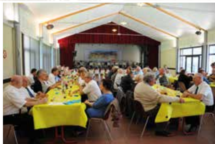
Un repas de fête... patronale