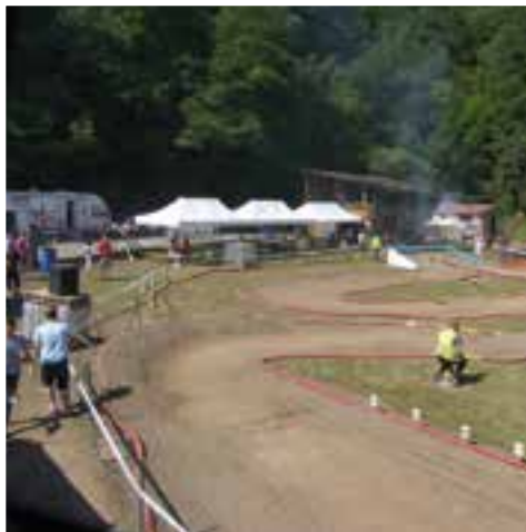
Le Buggy en action... sur le circuit de la Manufacture