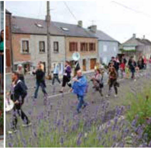
Une retraite aux flambeaux... qui sent bon la lavande