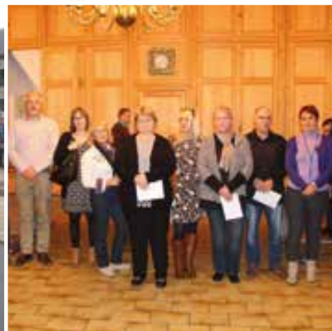
Concours des maisons fleuries... les primés "balcon"