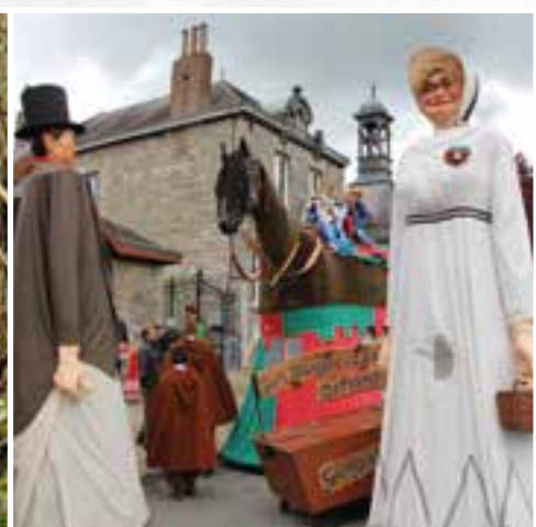
Un carnaval en hauteur... et à cheval