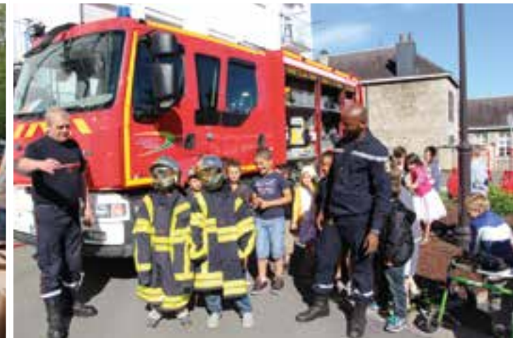
École Élémentaire... une brigade d'élèves-pompiers