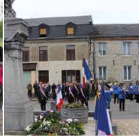
Cérémonie du 1 er mai ... un défilé au travail