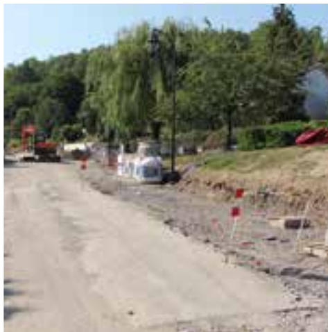
La rue des Écoles... en classe préparatoire