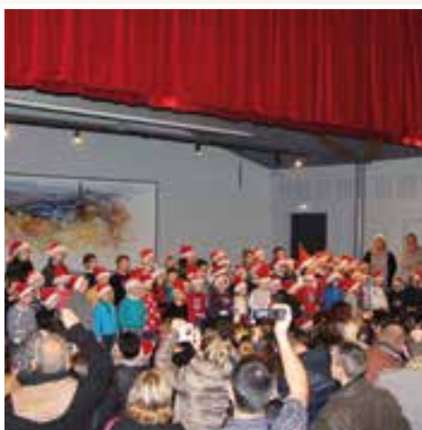
Marché de Noël... des airs de fête pour les enfants des écoles