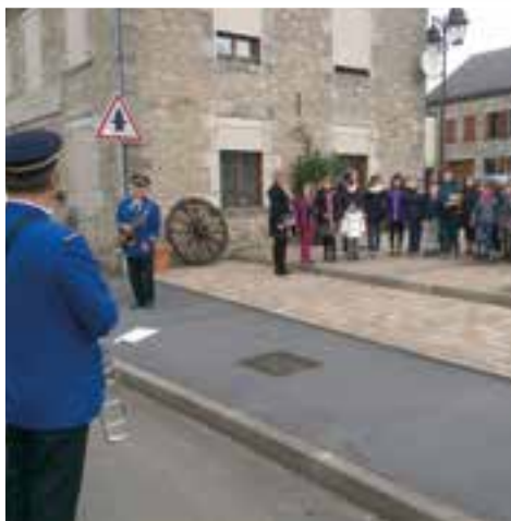
Cérémonie du 11 novembre... la Marseillaise chantée par les enfants