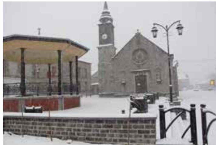
La place a revêtu... son manteau d'hiver