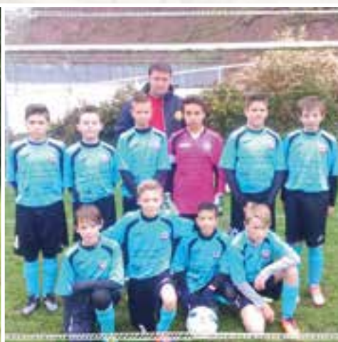
Une entente chez les U13... FCF/Chooz/Vireux