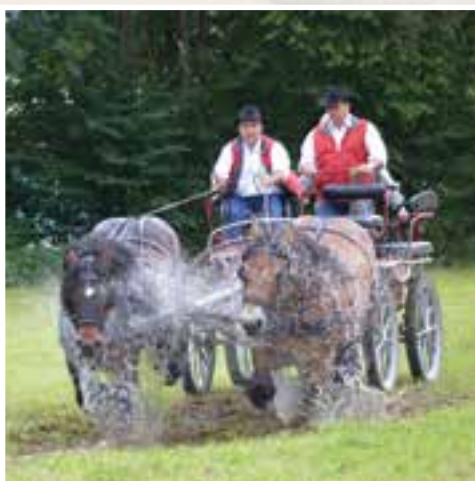
La Ferrade Fromelennoise... la fête du cheval à la Manufacture