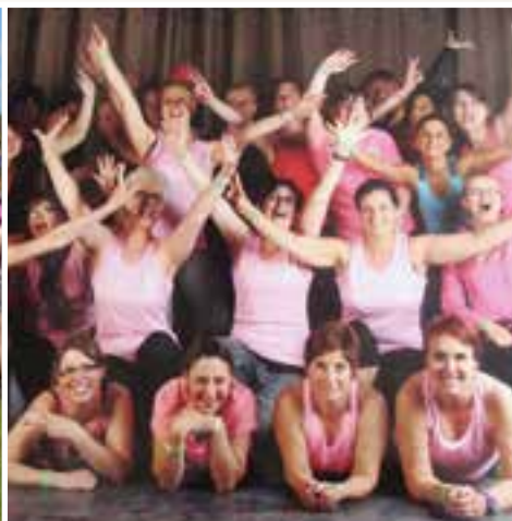
Association Vis ta Gym... les filles en pleine forme