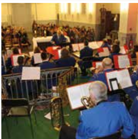
Sainte-Cécile à l'église... l'Harmonie Municipale fête sa patronne