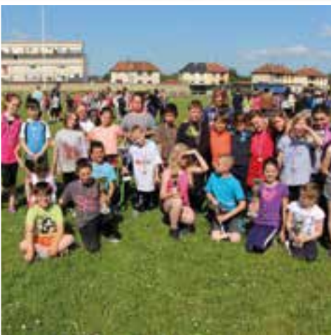
Course scolaire à Givet... une pluie de médailles pour nos élèves