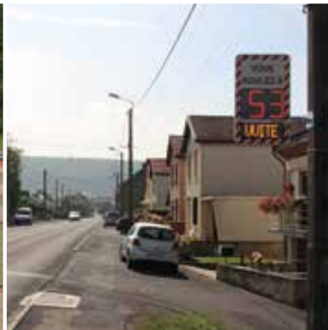
Le radar pédagogique... pour le respect de la vitesse !