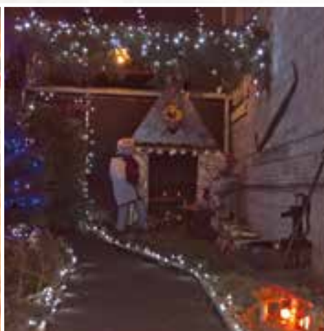
Un décor de fête... proposé par le service technique