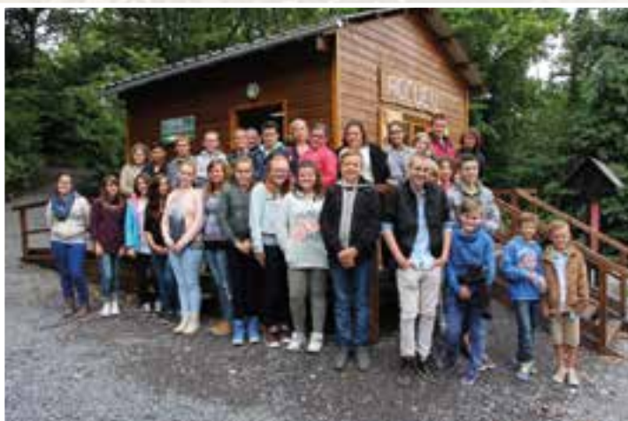
L'Athénée royal de Beauraing... étude en profondeur à Nichet