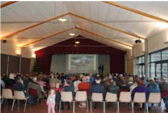
Une carte de meilleurs vœux... avec la Municipalité