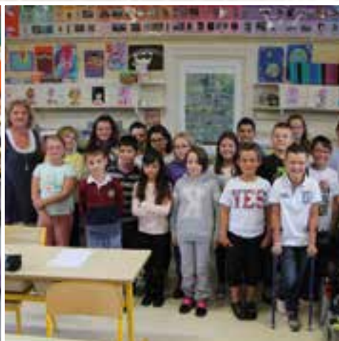
Une rentrée classe... avec les CM1 et CM2