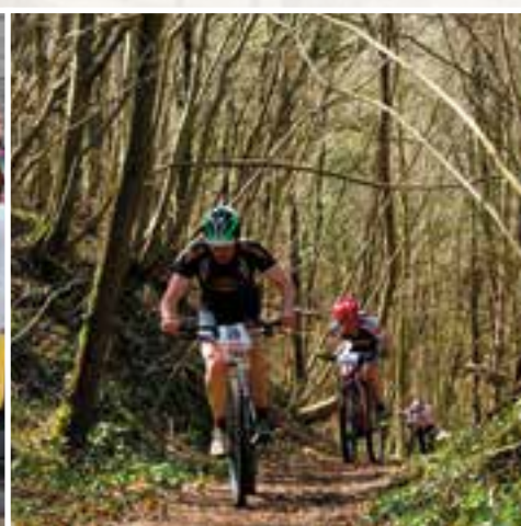
Championnat régional VTT... se chauffer au bois de Nichet