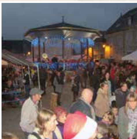
Marché de Noël... le kiosque s'illumine de bonheur