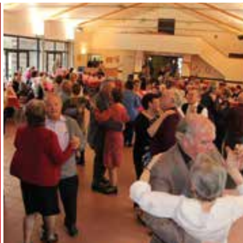
Repas des seniors... ce n'est pas tous les jours fête