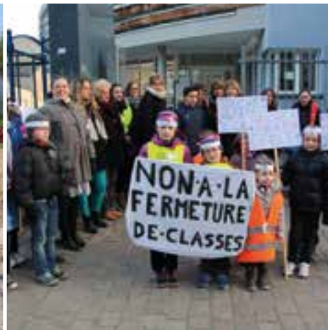
Sauvegarde de nos écoles... au tableau... parents d'élèves, élus, partenaires sociaux...