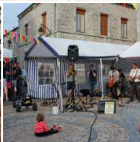
Fête de la musique ... ou début de l'été en décibels