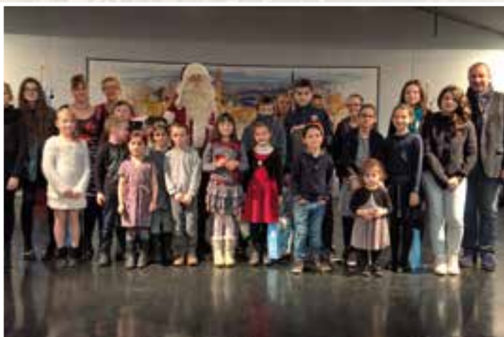
Les enfants du personnel communal... en scène