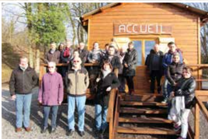
Aux grottes de Nichet... lancement de la saison touristique