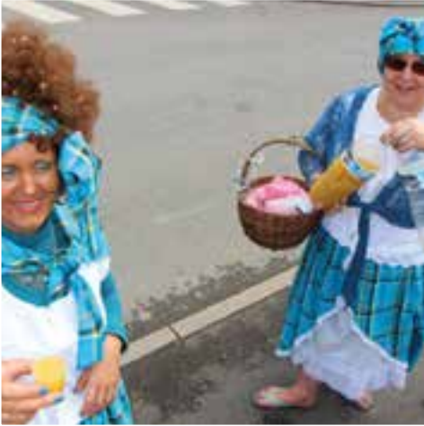
Un carnaval en vacances... avec des airs sous les tropiques