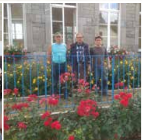
Une fleur... pour les jardiniers de la commune