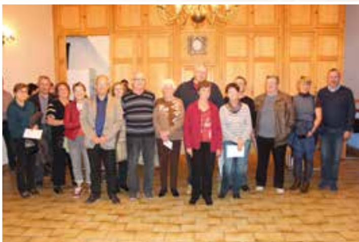
Un marché aux fleurs ... les primés "jardin"