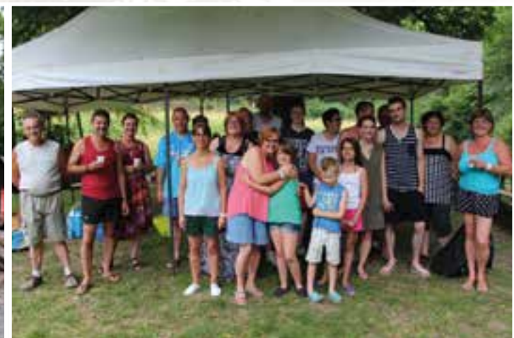
Rue des Écoles... les voisins en mode convivial