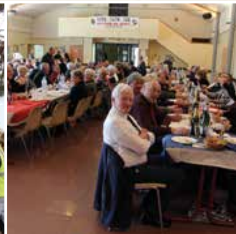
Repas des Anciens Combattants... la salle du Richat au garde à vous