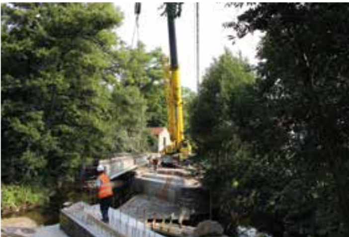
À la Manufacture... tout le monde sur le pont !