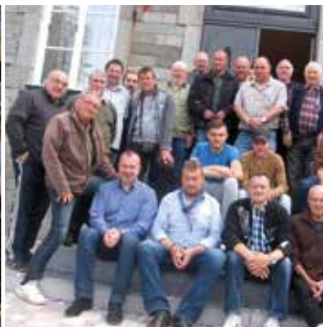
La société communale de chasse... aux aguets