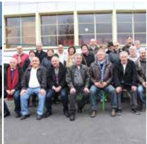
Un sans-faute... pour les retrouvailles d'anciens élèves