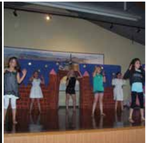
La fête des écoles... c'est bientôt les grandes vacances