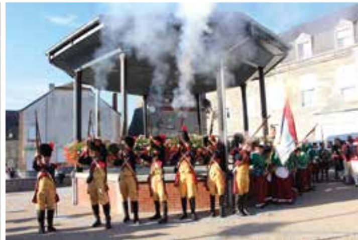
Les grenadiers Suisses... ou recevoir une décharge