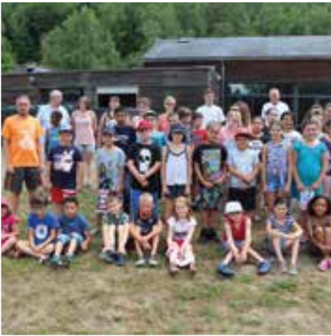
Le centre aéré d'été... que des enfants sages !