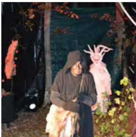
Halloween... osez défier les maléfices sur le site de Nichet