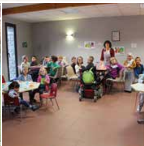
La restauration scolaire... les petits plats dans les grands