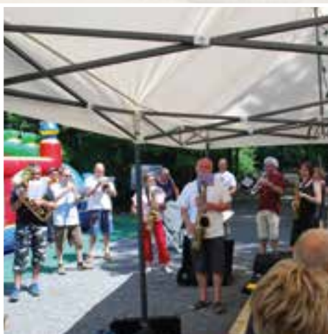
Barbecue de l'Harmonie... faites de la musique !