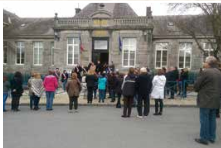
Deuil national... 1 minute de silence devant la maison communale