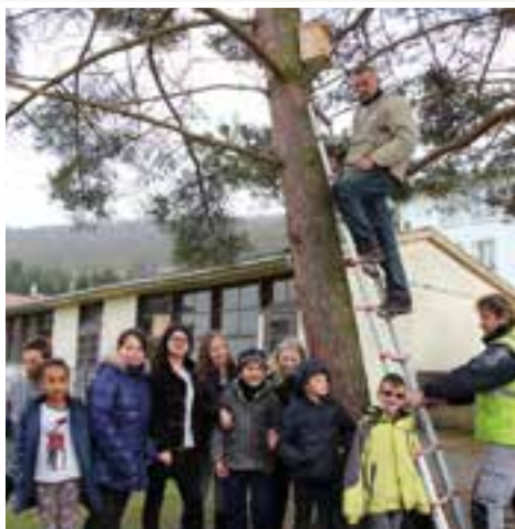
À l'école des Nutons... on piaille gaiement grâce au nichoir