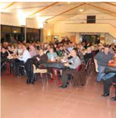
Repas de l'Harmonie... une choucroute bien garnie