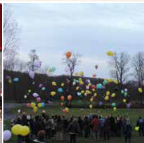
Téléthon... des ballons pour la bonne cause