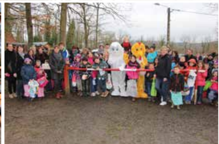
Le plateau de Nichet... un domaine de chasse aux œufs