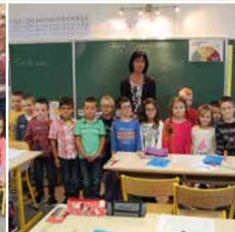
Au tableau ... la classe des CP et CE1