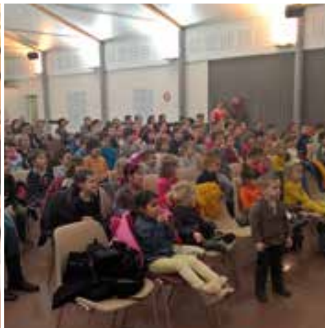
Spectacle de magie au Richat... les écoliers envoutés par les tours