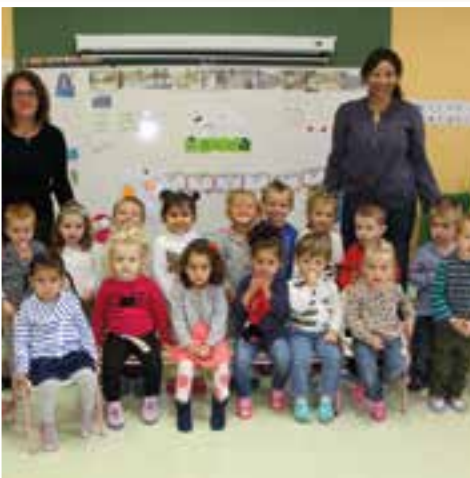
À bonne école... la classe des tout-petits et petits