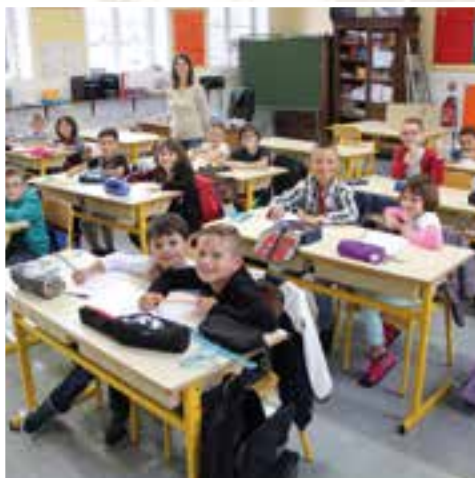
Une bonne note... la classe des CE1 et CE2