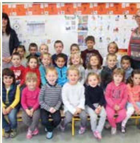
Sur les bancs d'école... la classe des moyens et grands