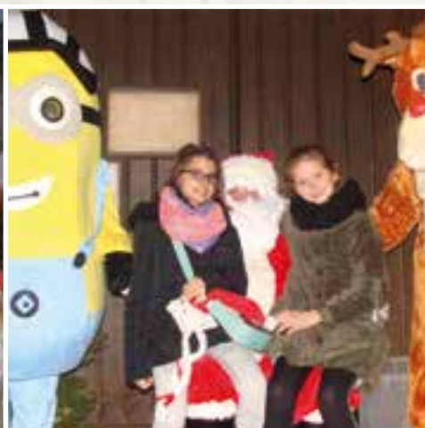
Place de l'Église... le Père Noël bien encadré