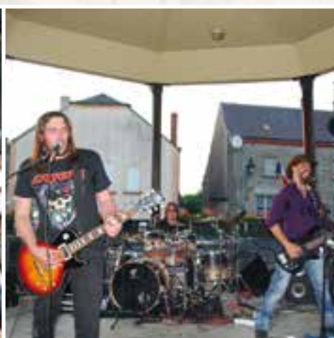
Fête de la musique... une vente en kiosque de revue musicale