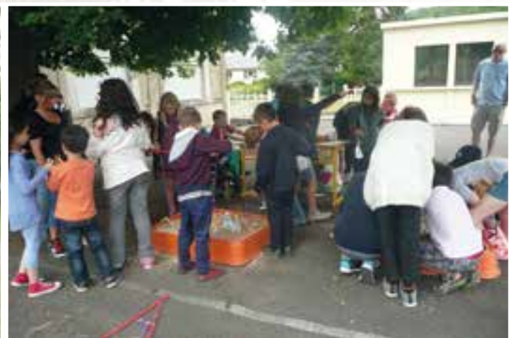
Kermesse élémentaire en deux actes... cour de l'école, jeux & animations