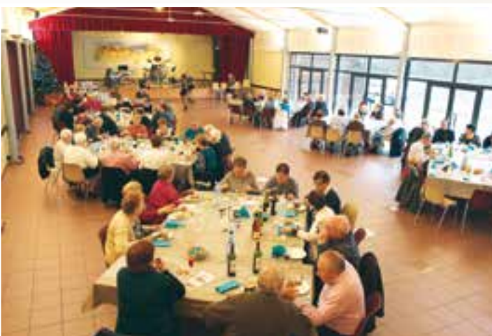
Au pied du sapin... on étrenne le coup de fourchette pour le repas des seniors