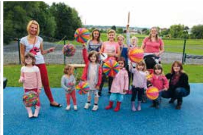
Sur l'air des lampions... le 13 juillet illumine l'aire de jeux du Richat