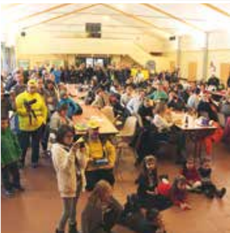
Téléthon... un élan de solidarité pour une cause nationale