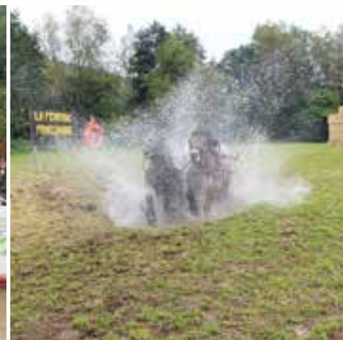
16 e édition de la fête du cheval... un bon pari pour la Ferrade