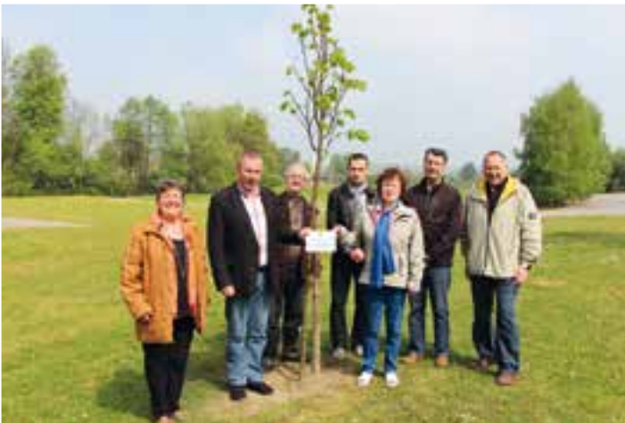
50 ans du Lions club de Givet... aupès de mon arbre, je vivais heureux