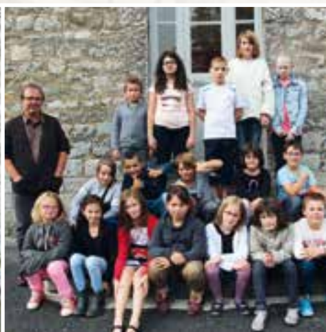
C'est dans la poche... une rentrée scolaire hors classe