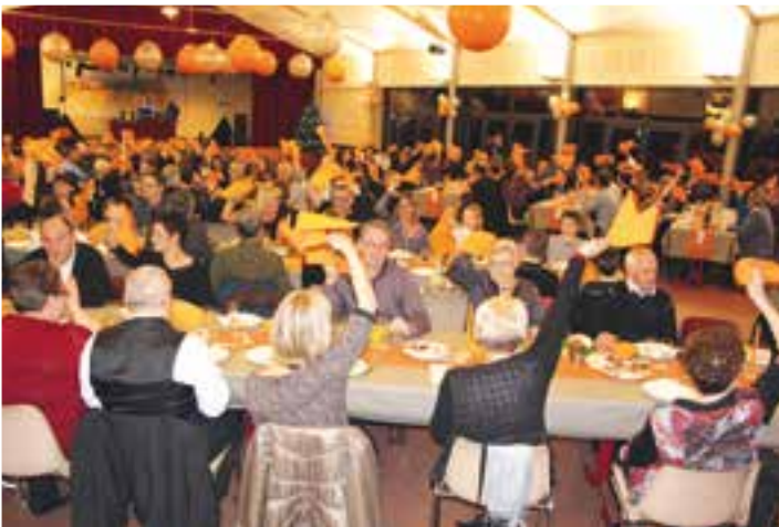
1 er janvier au Richat... et on fait tourner les serviettes