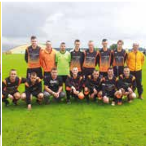
Couleur Tango... les seniors "A" du FCF sur le tapis vert