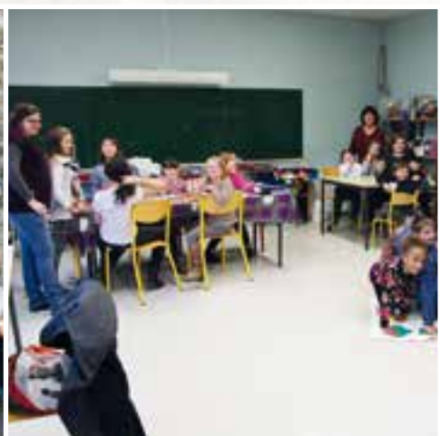
Temps d'Activités Périscolaires... les animateurs du "Lien" en atelier