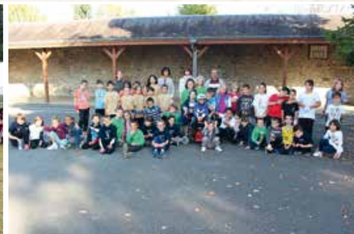
Journée du sport à l'école primaire... être bien en cour