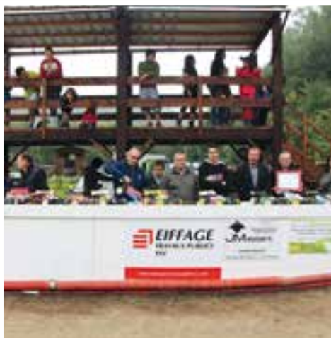
Association Buggy Fromelennes Radio-Commandé... un départ sur les chapeaux de roues