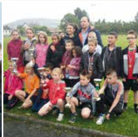
Cross des Primaires... l'école dans la course des trophés