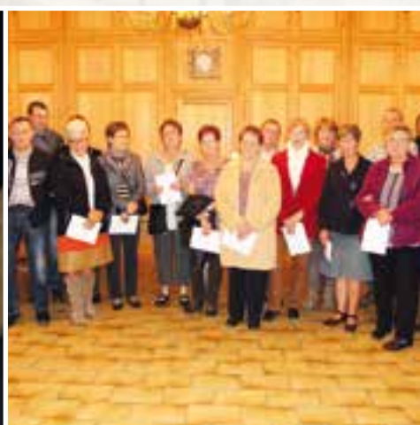
Maisons fleuries de la commune... un rapport qualité - prix