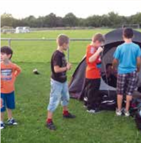
Centre aéré d'été... ça te tente de dormir à la belle étoile !