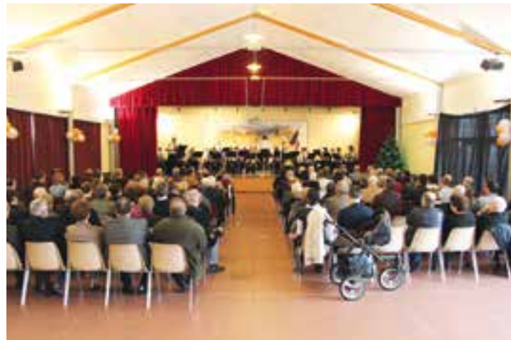
Vœux de la Municipalité... # en ligne