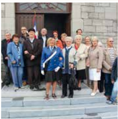
Fête patronale... fidèle à la tradition avec la célébration religieuse