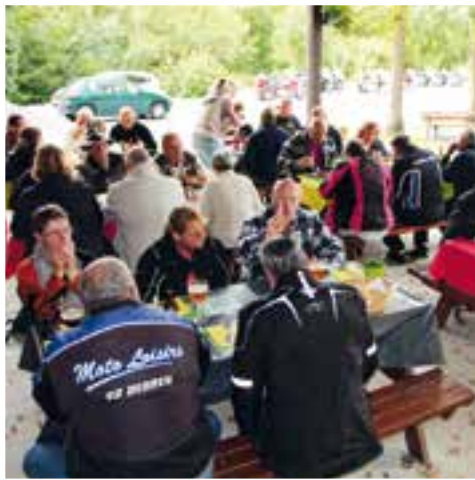
Le tourisme à moto... une bonne tenue de route à Nichet