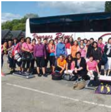
Vis ta Gym... un départ pour la 3 e nuit du fitness à Charleville