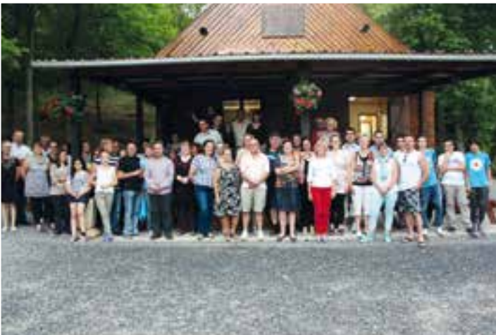
Liberté, égalité, fraternité... pour l'équipe communale