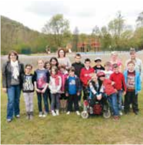
Alsh printemps... un terrain de loisirs éducatifs