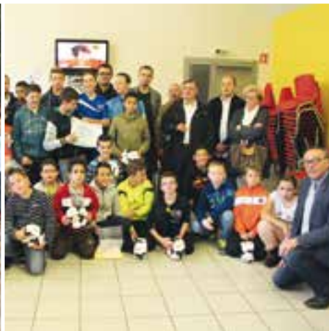
École de foot Givet/Fromelennes... un label de qualité FFF