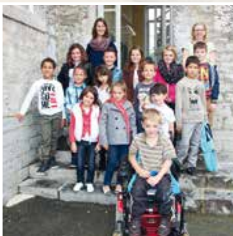
Nouveaux rythmes scolaires... avec la semaine à 4,5 jours