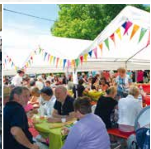
Harmonie Municipale... à la bonne franquette avec le repas champêtre