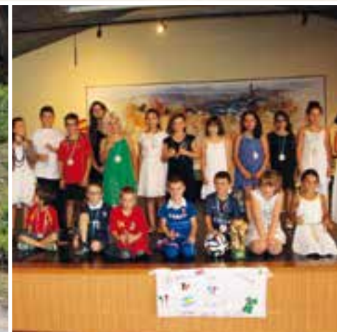
L'Alsh en clap de fin... une version coupe du monde "samba brésilienne"