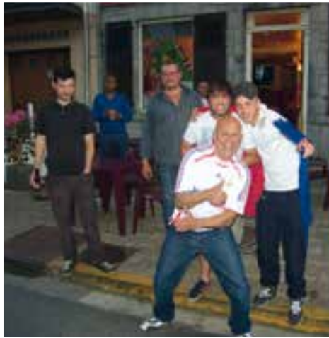
Café des sports à l'heure du mondial... les supporters dans la rue