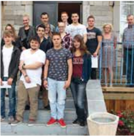
Jobs d'été... une bande de 12 jeunes devant la maison communale