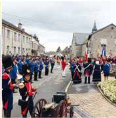
3 e régiment des Grenadiers Suisses... coups de canon pour les 15 ans