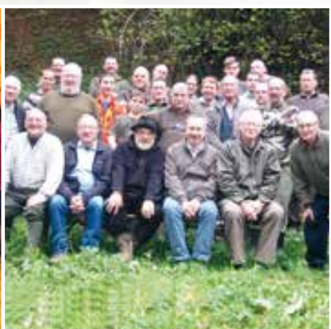
Saint-Hubert ... les chasseurs en taille patron