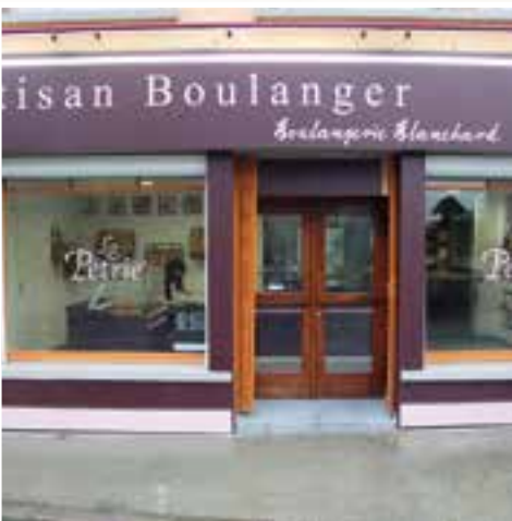
La boulangerie... enfile un habit de jeune