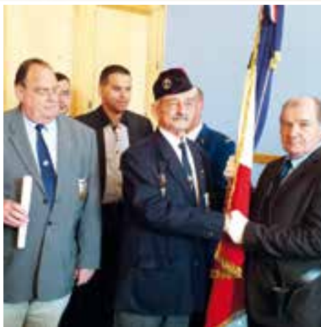
Section Fromelennoise... passion du drapeau des anciens combattants