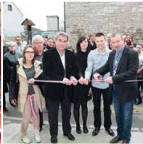
Inauguration de la boulangerie... les élus au fournil