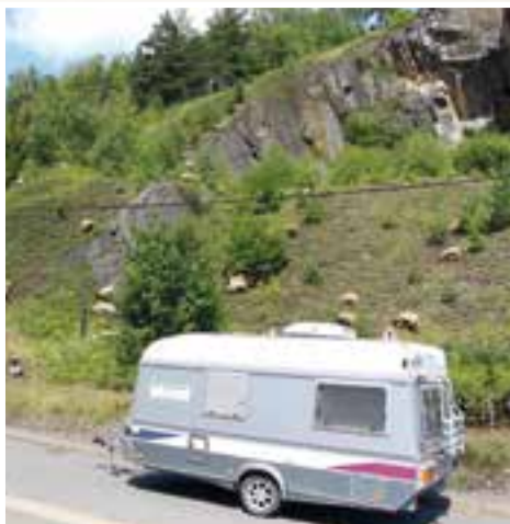
Terne des Marteaux... des débroussailleuses écologiques