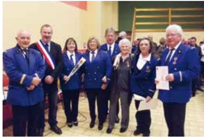
Sainte-Cécile de l'Harmonie Municipale... jouez pour nous!