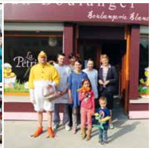
Joy'œufs de Pâques... un épisode en chocolat