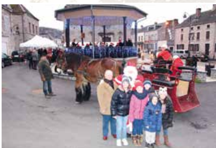
En mode hiver... avec l'aubade de Noël, place de l'Église