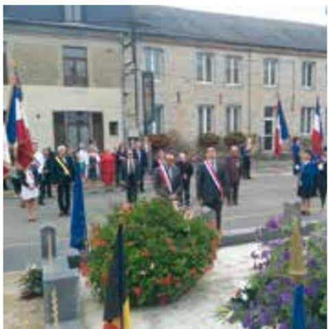
Devoir de mémoire... cérémonie de la libération de Fromelennes