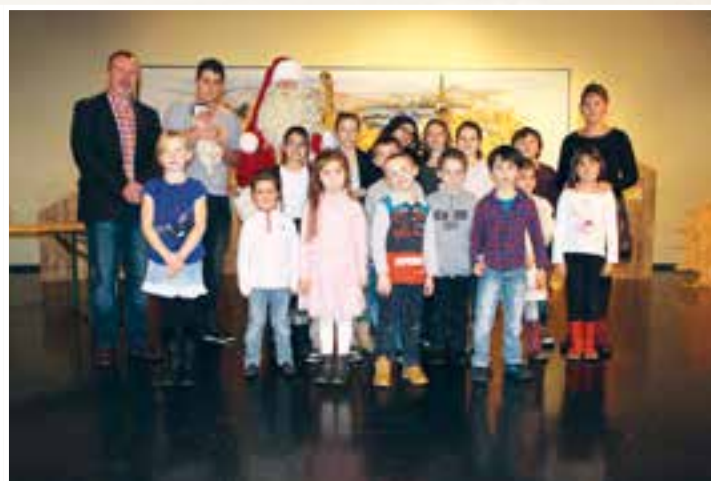
Décoration de Noël... la crèche communale