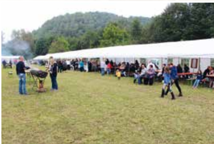
Remède de cheval... barbecue, randonnée équestre, balade en calèche