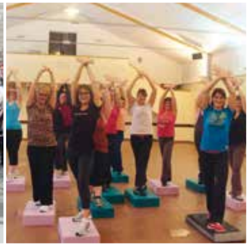
L'association Vis ta Gym... en forme