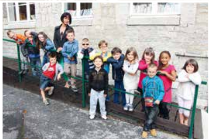
Au primaire... un train de réformes scolaires, tenir bon la rampe