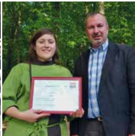
Au chalet des Grottes... un cadre en bois avec CL traiteur