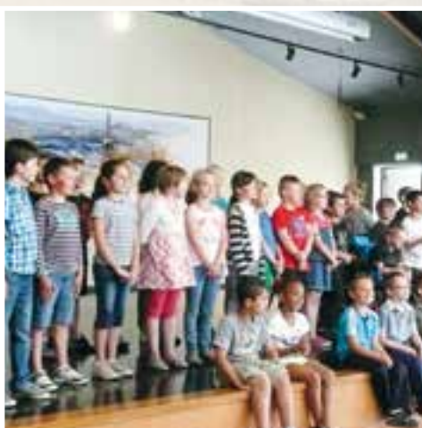
Salle du Richat... une mise en scène avec saynètes & chorale