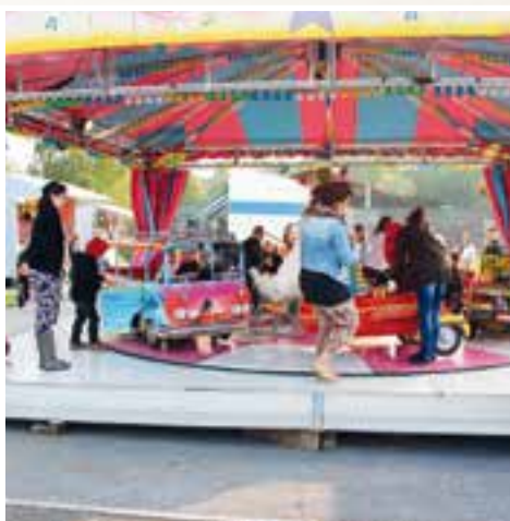
Tournez manège... le retour aux quatre jours de festivités