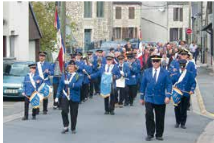
Le 1 er Mai... un brin de musique pour un brin de bonheur