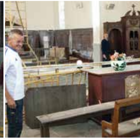
Église Saint-Laurent... une rénovation intérieure en grand seigneur