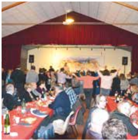
Choucroute de l'Harmonie... ça mijote dans le chaudron