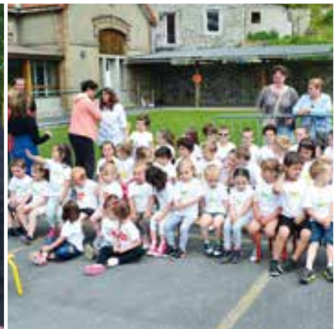
École Maternelle... mini-scolaires pour des mini-olympiades