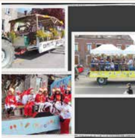
Carnaval... un spectacle de rue en carriole