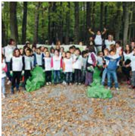
Des éco-citoyens soucieux de l'environnement... de l'école des Nutons