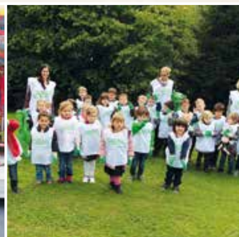
Nettoyons la nature... petits protecteurs de l'école Maternelle