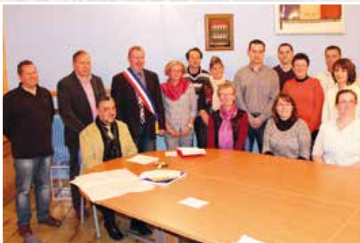
Élections municipales... avec le XV communal, essai transformé