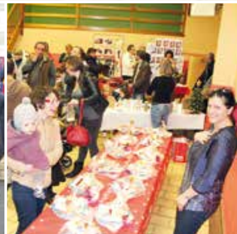
Un marché scolaire... Noël rime avec Maternelle