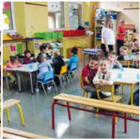
À la Maternelle... des doudous en première classe