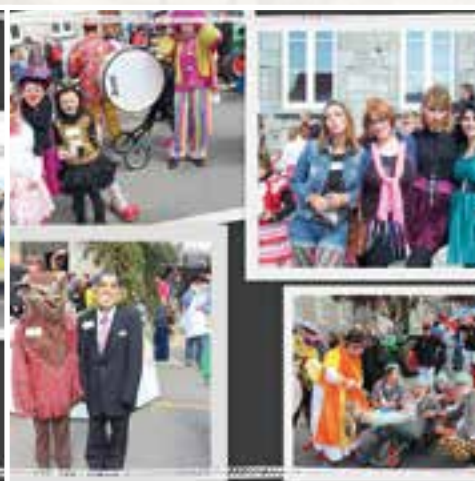
Collection de printemps... un défilé à la mode