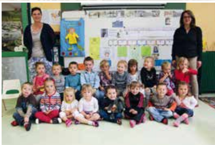
Une carte de famille nombreuse... en seconde classe