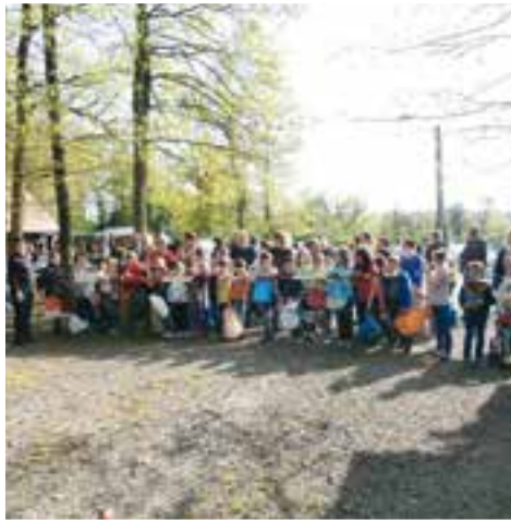
Sur le site de Nichet... à Pâques, une crise de succès