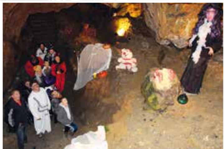
Fête d'Halloween... un mélange de légende et de l'étrange