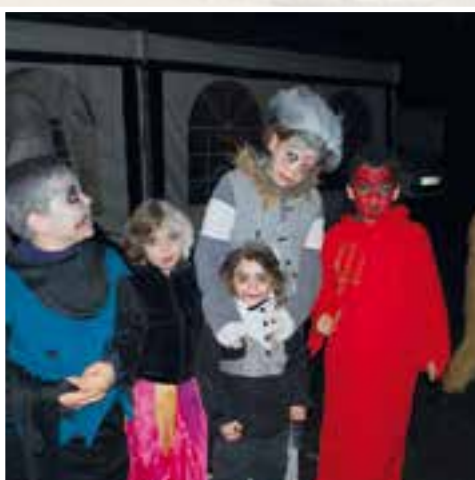
Un show... effroi avec l'anxiété, le frisson, les rires et les pleurs