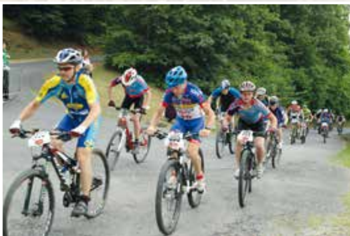
X-country... une visite mécanique du site de Nichet