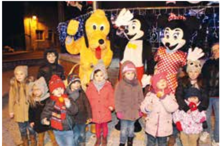
Mission de Noël... avec le Comité des Fêtes, la Ferrade & l'Harmonie Municipale

| Conception | Prépresse | Charte graphique | Logotype | Packaging | Réalisation de documents administratifs | Office | Etiquette | Brochure | Catalogue | Plaquette | Flyer | Dépliant | Affiche | Carterie