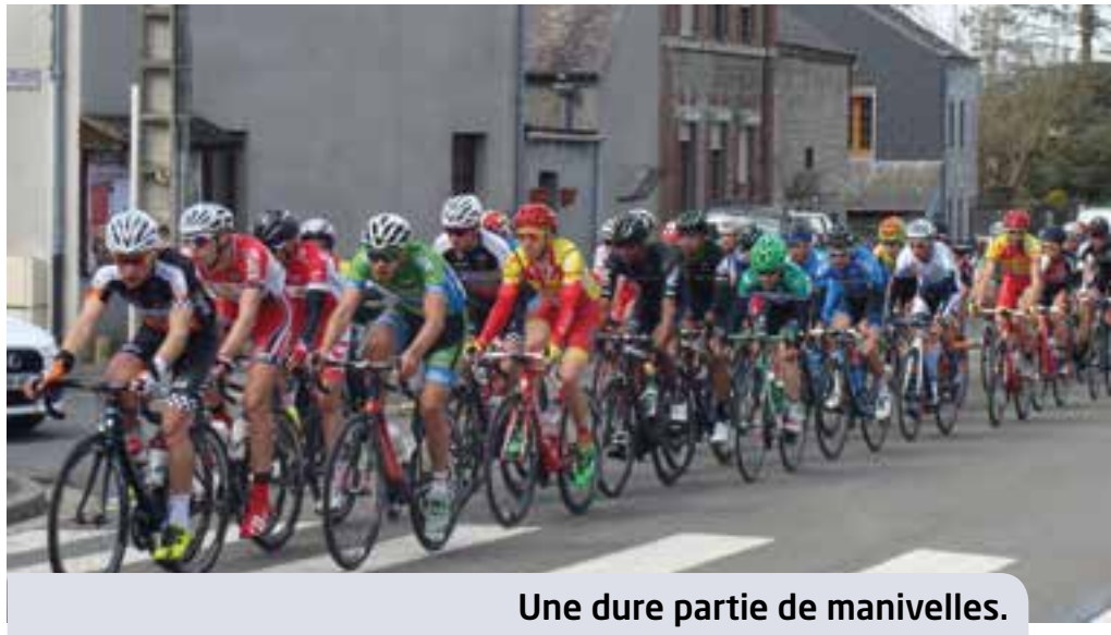
Une dure partie de manivelles.

Au sein de la commune, lors du passage de la caravane publicitaire puis des coureurs, de nombreux habitants ont tenu à saluer l'événement au bord de la route.