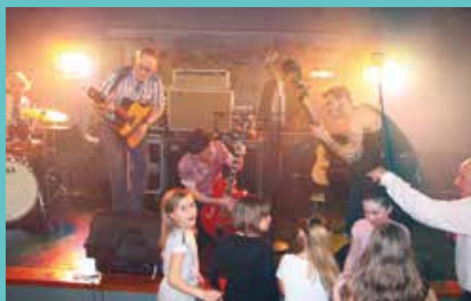
Un classico... on a "zlatané"... vivement le match retour.