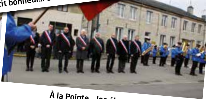
À la Pointe... les élus en fête