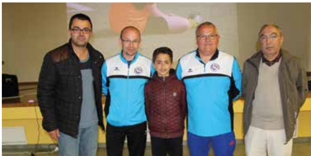
Carton plein... pour la Pointe.

Le coup de sifflet final du stage a réuni les éducateurs, les bénévoles, les responsables de club et les parents