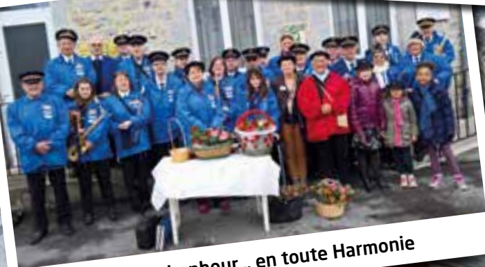
Au petit bonheur... en toute Harmonie