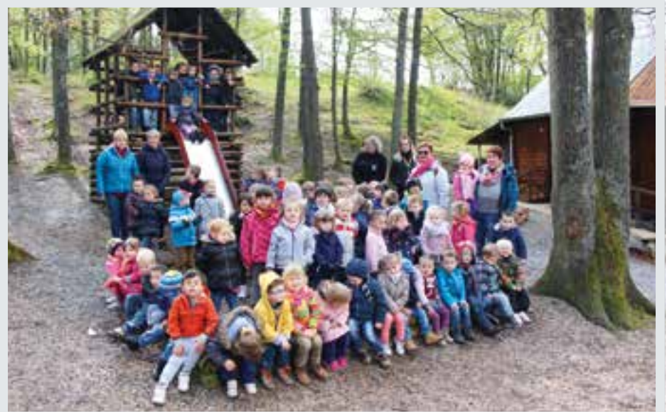
Une sortie classe pour 70 enfants âgés de 2 ans ½ à 6 ans de l'Athénée Royal de Beauraing.