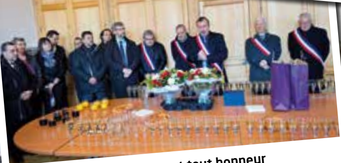
En tout bien... et tout honneur